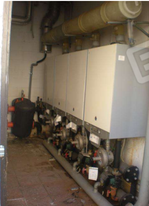
Foto 44 zona cortile abitazione-box auto-magazzino