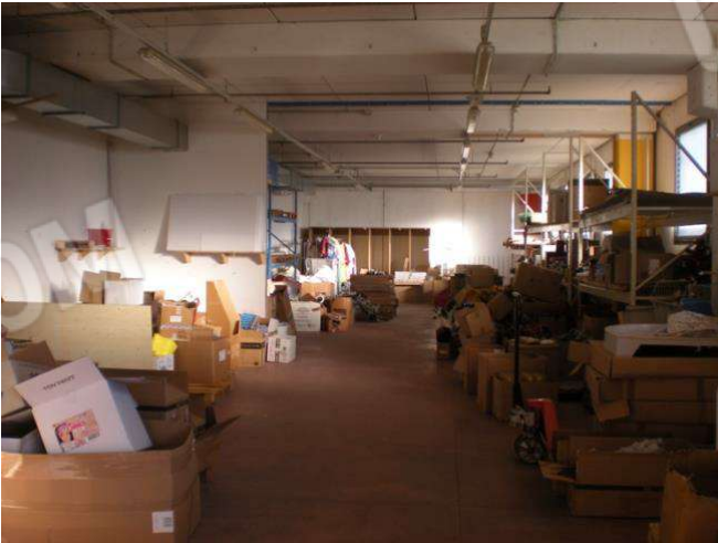
Foto 18 zona autorimessa-magazzino