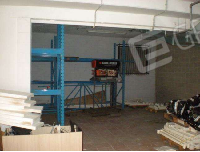
Foto 20 autorimessa magazzino