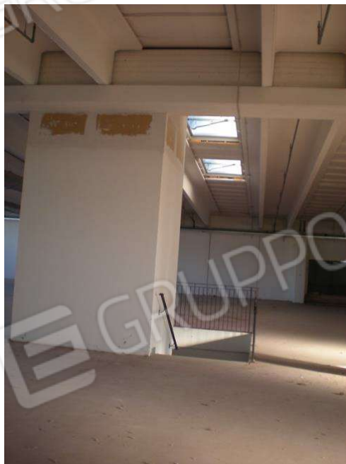
Foto 36 particolare arrivo elevatore al piano