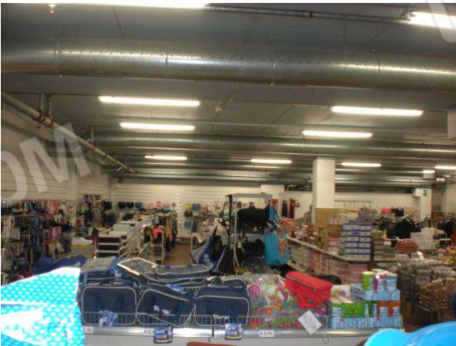
Foto 15 camerini prova