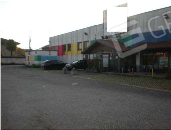
Foto 2 facciata nord