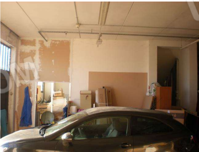
Foto 21 zona giochi bar-ristorante