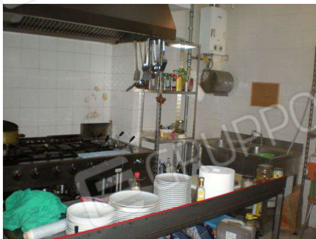
Foto 24 servizio zona bar-ristorante