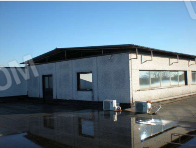
Foto 42 lato ovest deposito e adiacenze altre proprietà