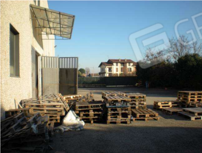
Foto 11 vista complessiva capannone lati est-sud