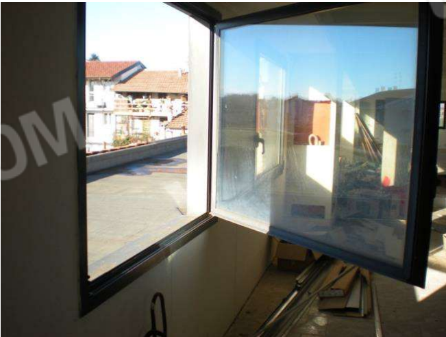
Foto 33 solaio di copertura lato ovest