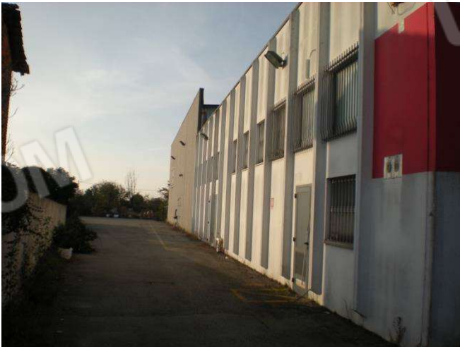
Foto 6 cabina ENEL posizione