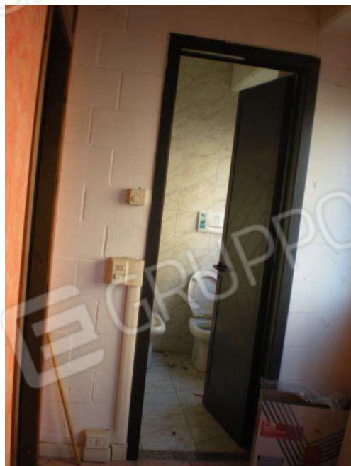
Foto 48 autorimessa