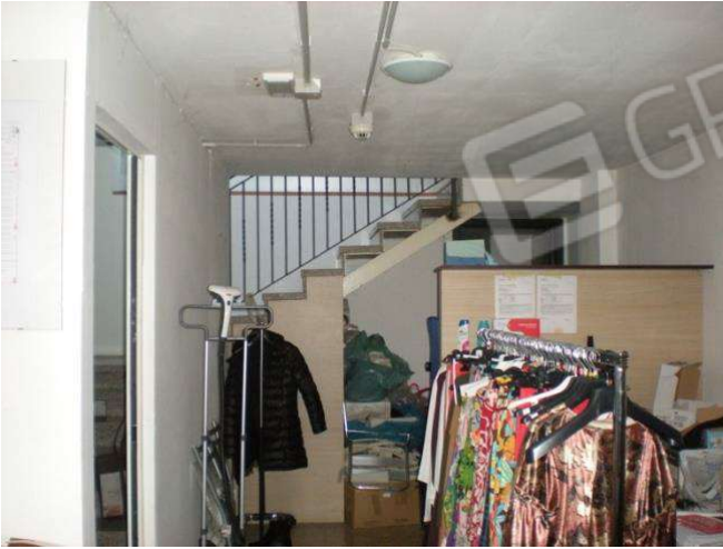
Foto 17 zona magazzini