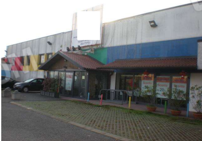
Foto 3 vetrate zona bar ristorante