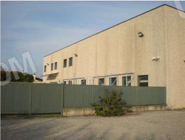
Foto 9 lato sud vista da cortile