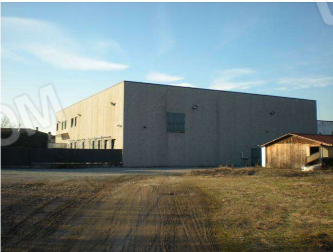
Foto 12 cabina ENEL