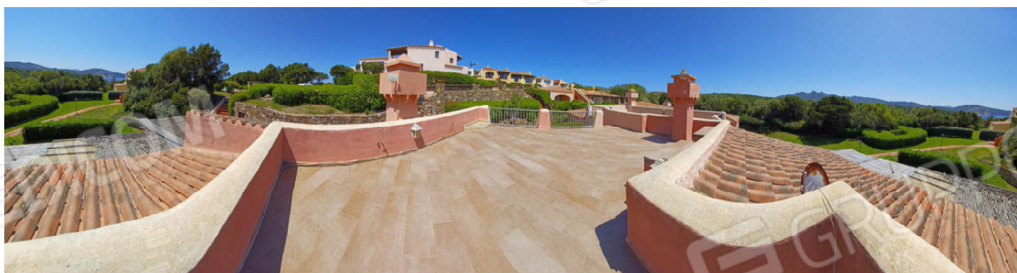
Foto 22 Terrazzo.