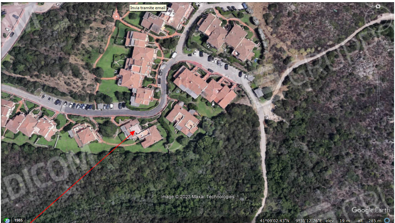
Foto 2 Contestualizzazione dell'immobile , la freccia indica la posizione dell' immobile oggetto di perizia.