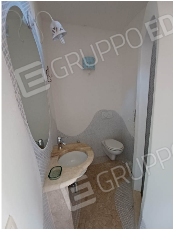
Foto 7 Bagno.