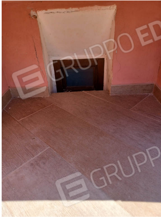
Foto 23 Finestra Bagno.