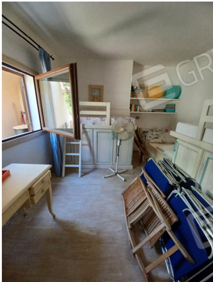
Foto 6 Camera.