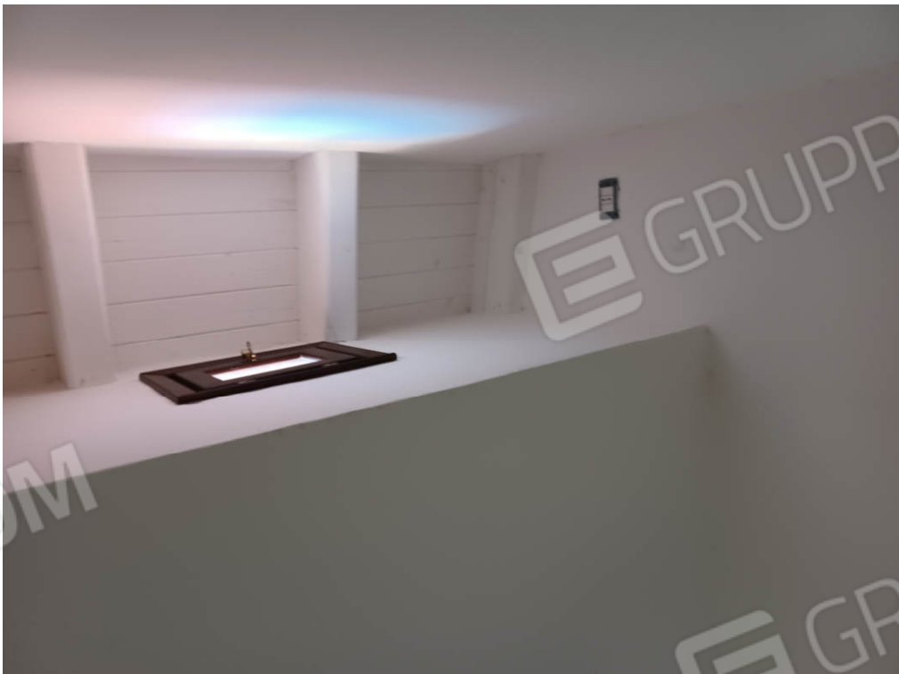
Foto 18 Finestra Bagno.