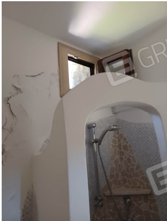
Foto 8 Finestra Bagno .