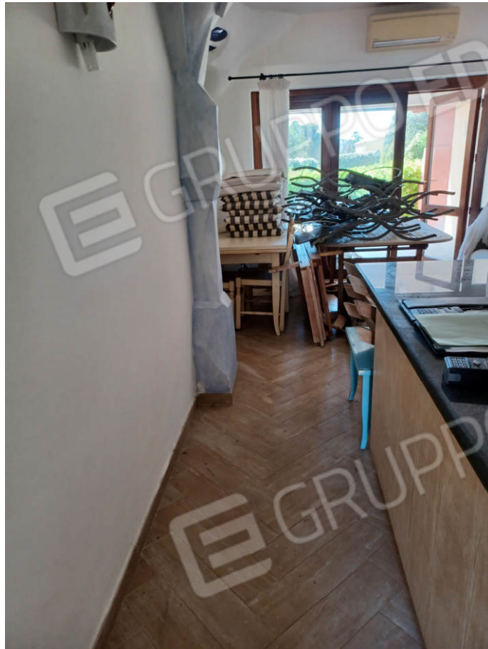
Foto 9 Soggiorno.