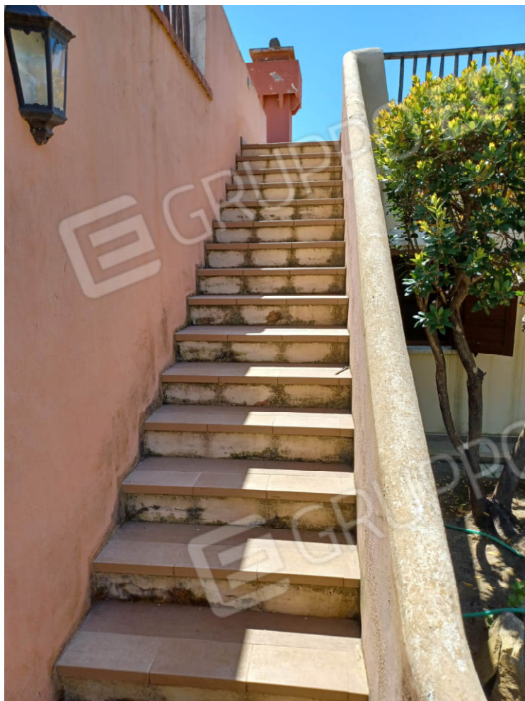
Foto 21 Scala di accesso al terrazzo.