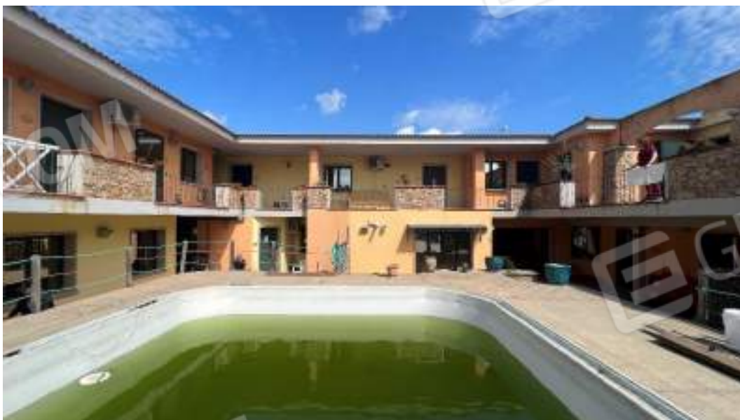
Figura 7 – Viste della corte e delle facciate interne del fabbricato