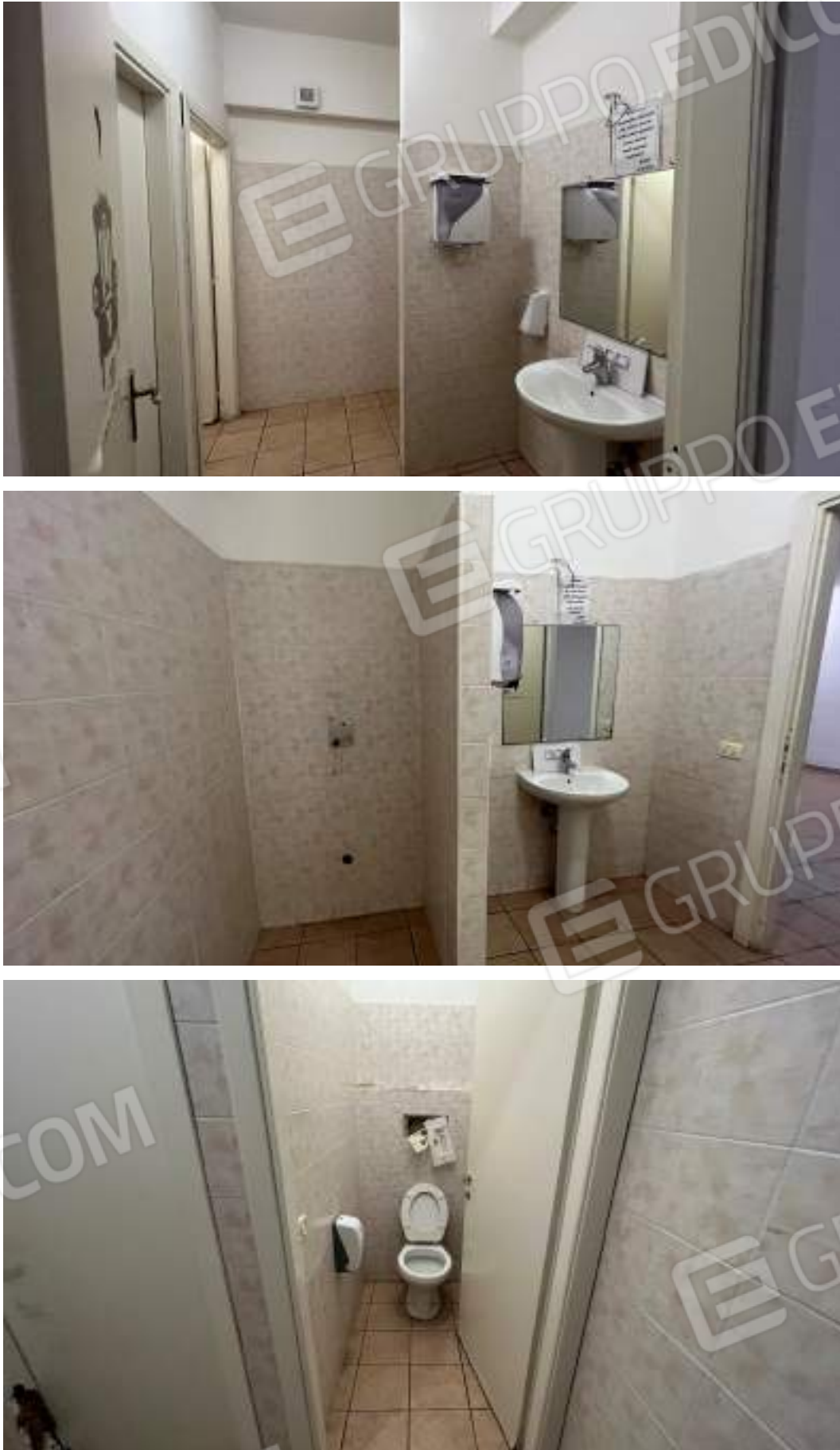
Figura 17 – Viste interne dello spazio adibito a locale Bar – piano interrato