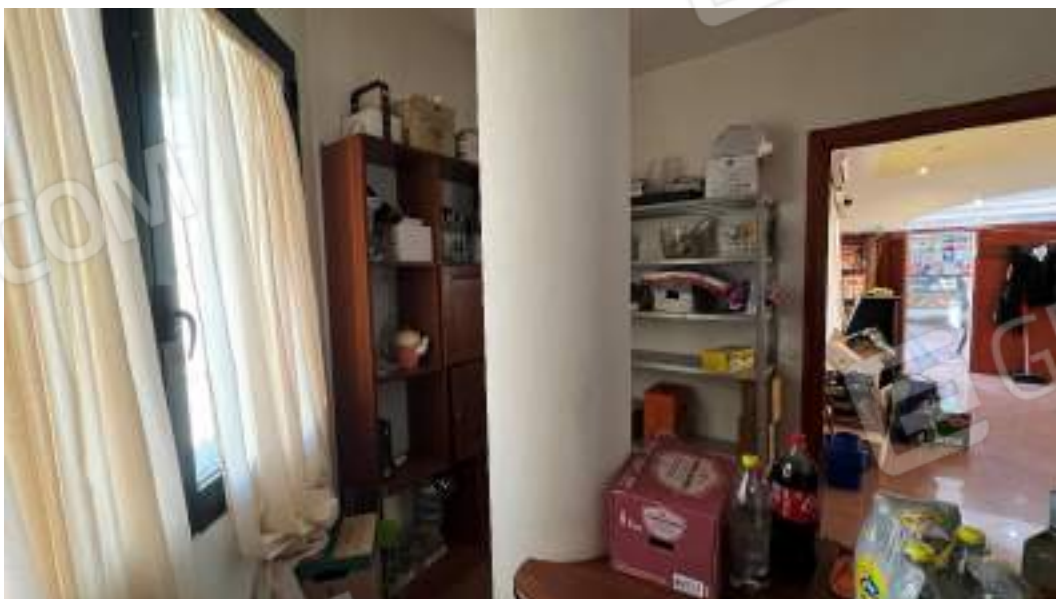
Figura 13 – Viste interne dello spazio adibito a locale Bar – piano terra