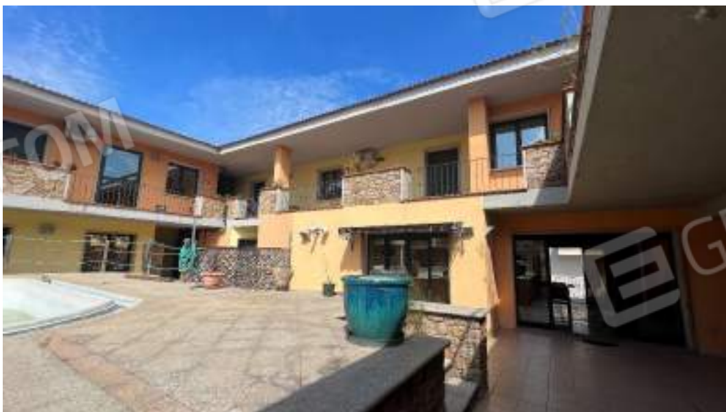
Figura 6 – Viste della corte e delle facciate interne del fabbricato