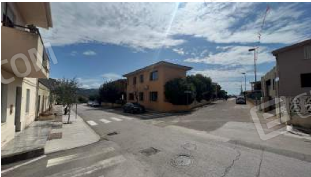
Figura 2 – Viste delle facciate fronte strada del fabbricato