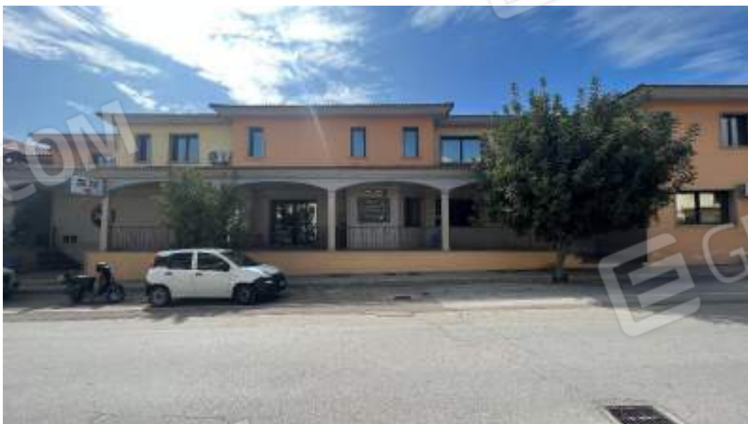
Figura 1 – Viste delle facciate fronte strada del fabbricato