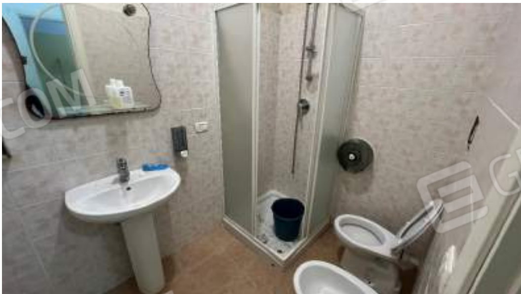
Figura 19 – Viste interne dello spazio adibito a locale Bar – piano interrato