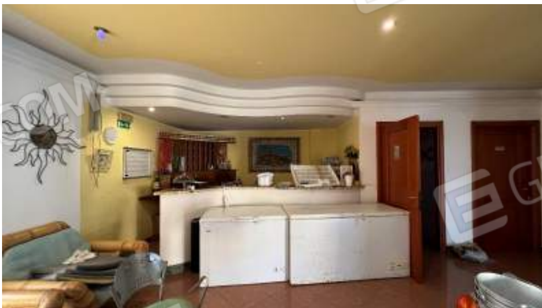
Figura 11 – Viste interne dello spazio adibito a locale Bar – piano terra