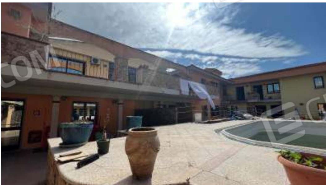
Figura 5 – Viste della corte e delle facciate interne del fabbricato