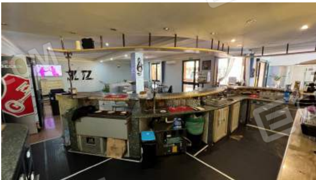
Figura 10 – Viste interne dello spazio adibito a locale Bar – piano terra