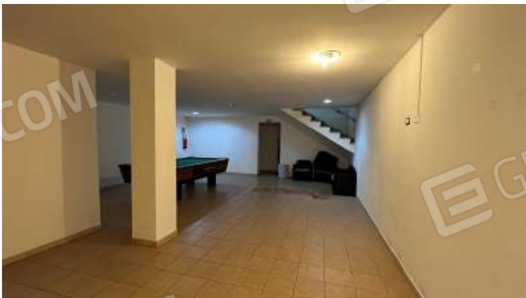
Figura 15 – Viste interne dello spazio adibito a locale Bar – piano interrato