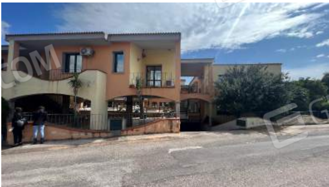
Figura 3 – Viste delle facciate fronte strada del fabbricato