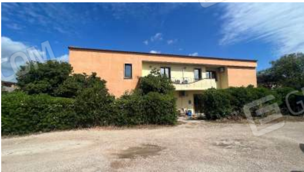
Figura 4 – Viste delle facciate fronte strada del fabbricato