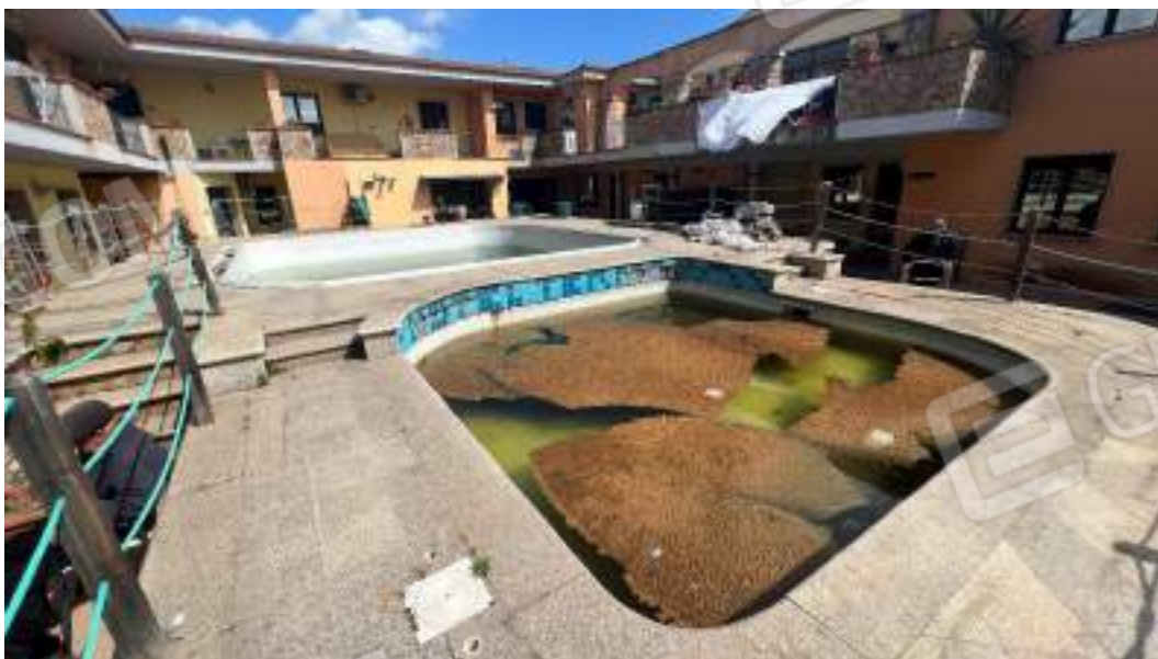
Figura 8 – Viste della corte e delle facciate interne del fabbricato