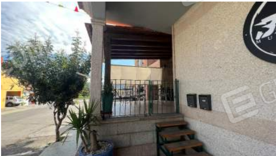
Figura 9 – Viste esterne dello spazio adibito a locale Bar