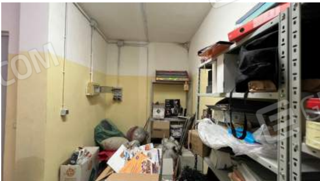
Figura 20 – Viste interne dello spazio adibito a locale Bar – piano interrato