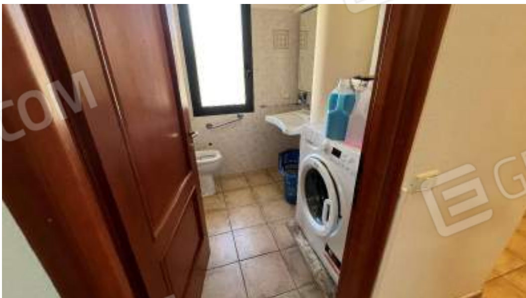
Figura 36 – Viste interne del fabbricato – piano primo