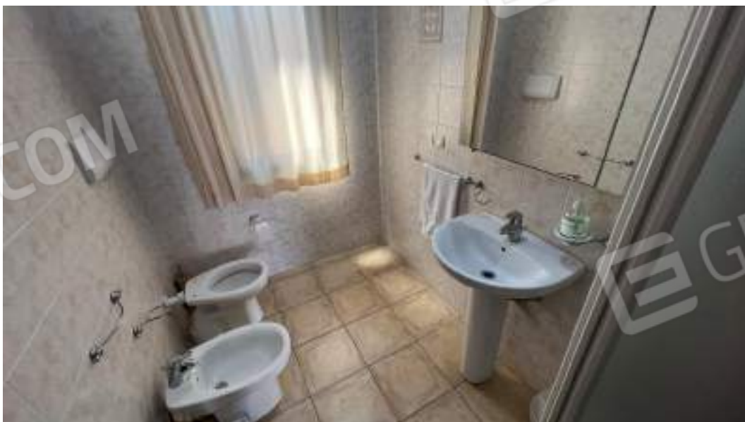
Figura 17 – Viste interne del fabbricato – piano terra