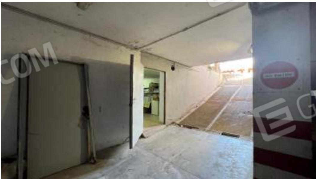
Figura 9 – Viste interne del fabbricato – piano interrato