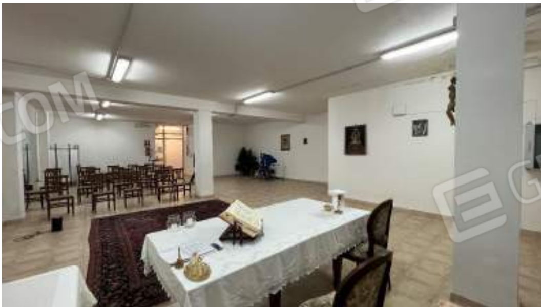
Figura 2 – Viste interne del fabbricato – piano interrato