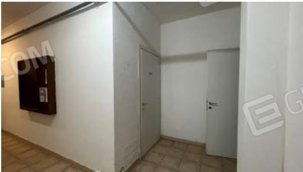
Figura 3 – Viste interne del fabbricato – piano interrato