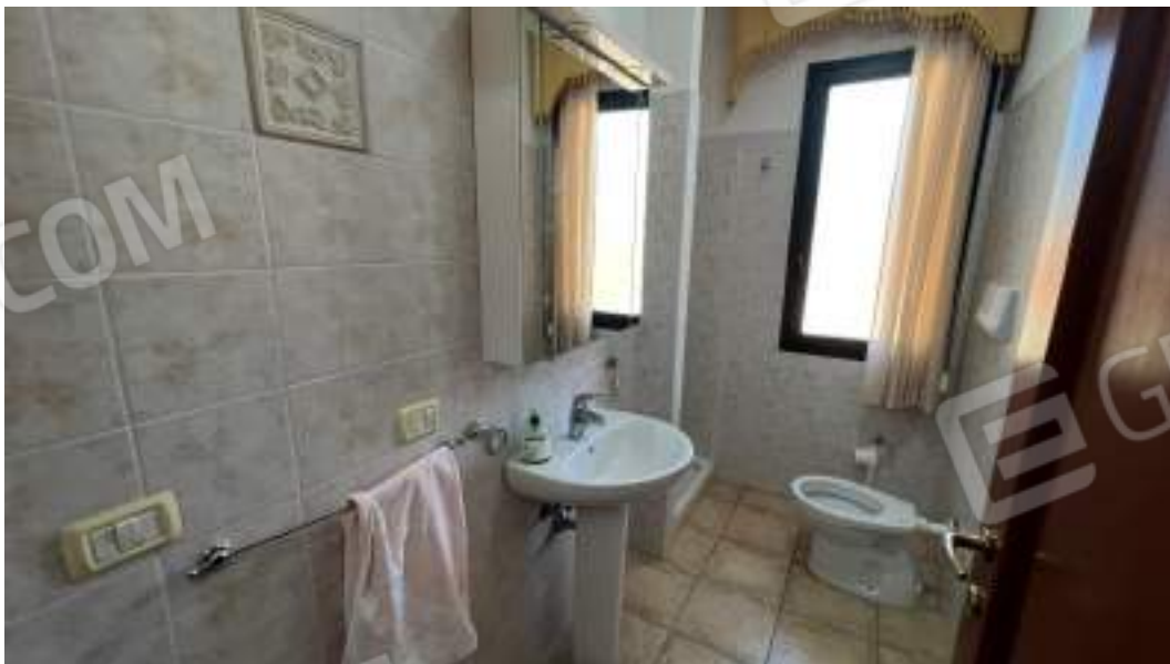
Figura 35 – Viste interne del fabbricato – piano primo