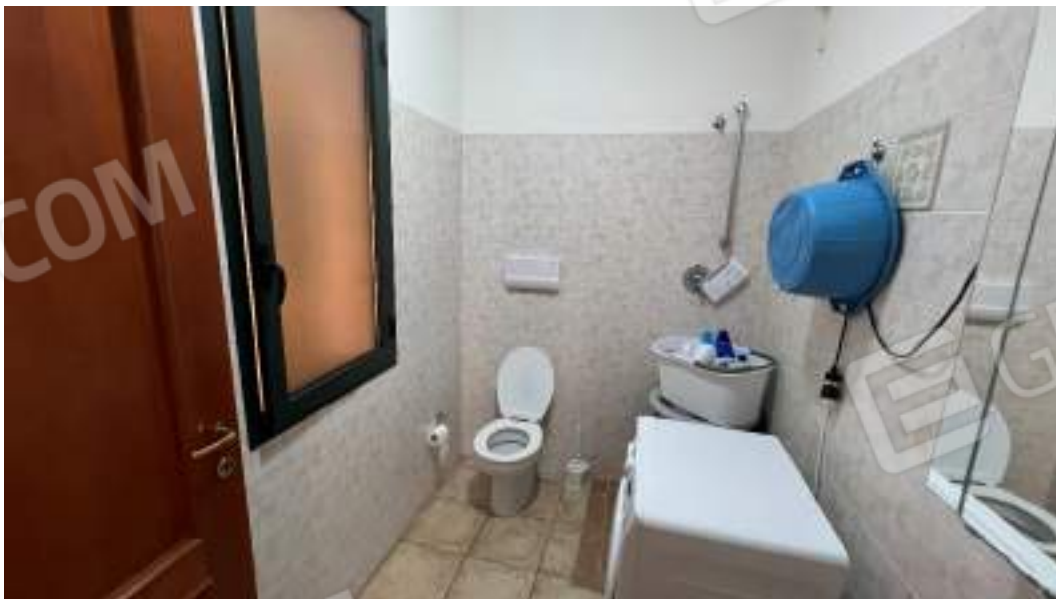
Figura 27 – Viste interne del fabbricato – piano terra