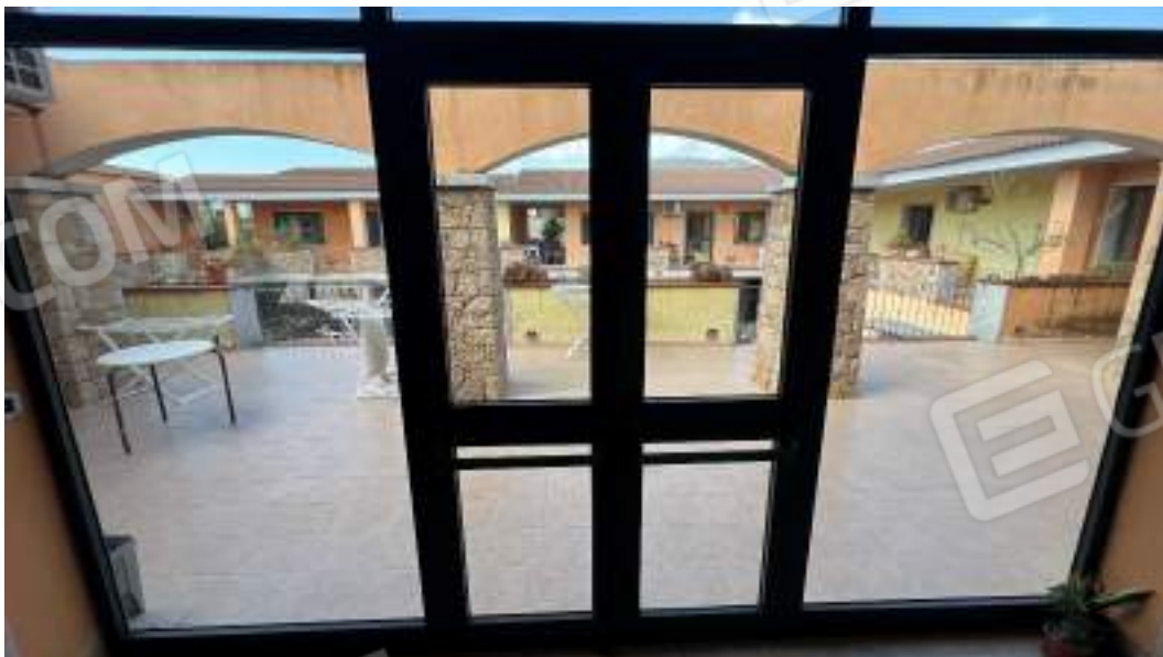
Figura 42 – Viste interne del fabbricato – piano primo