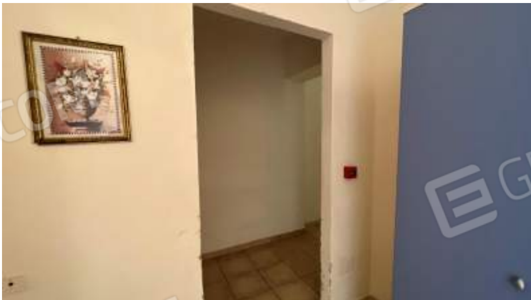
Figura 39 – Viste interne del fabbricato – piano primo