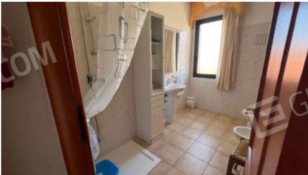
Figura 29 – Viste interne del fabbricato – piano primo