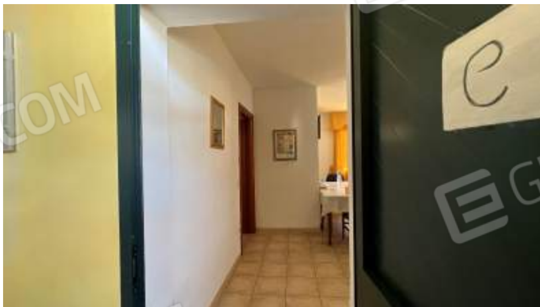
Figura 46 – Viste interne del fabbricato – piano primo