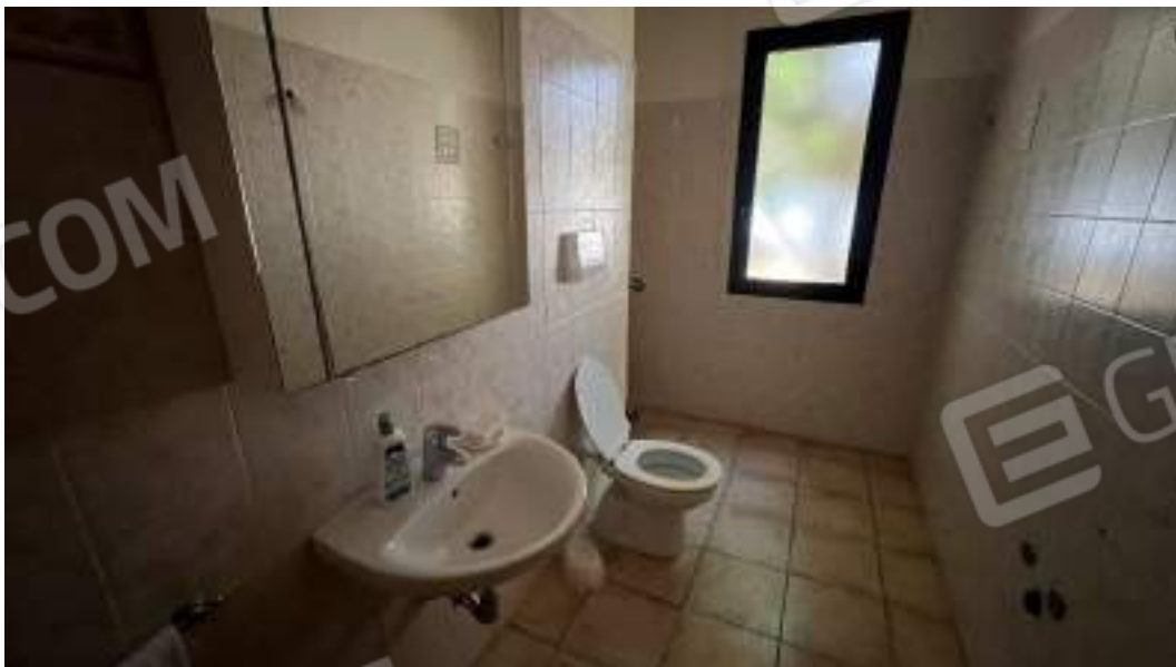
Figura 24 – Viste interne del fabbricato – piano terra