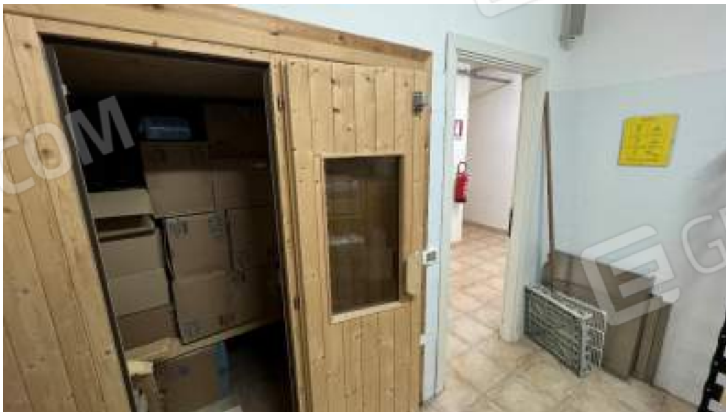
Figura 6 – Viste interne del fabbricato – piano interrato