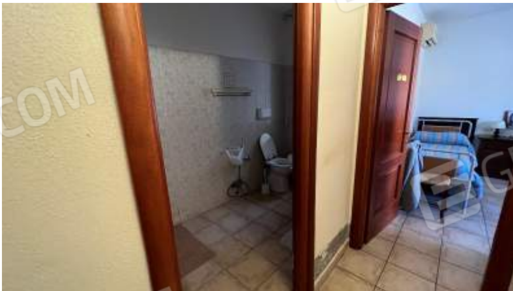
Figura 25 – Viste interne del fabbricato – piano terra