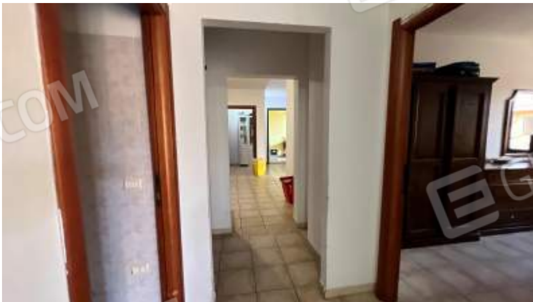
Figura 43 – Viste interne del fabbricato – piano primo