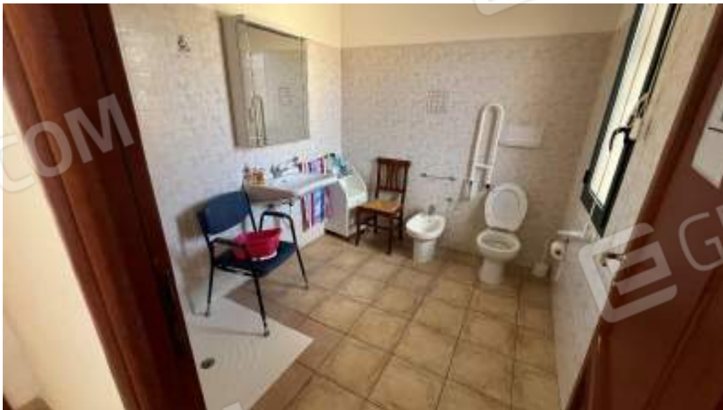
Figura 48 – Viste interne del fabbricato – piano primo