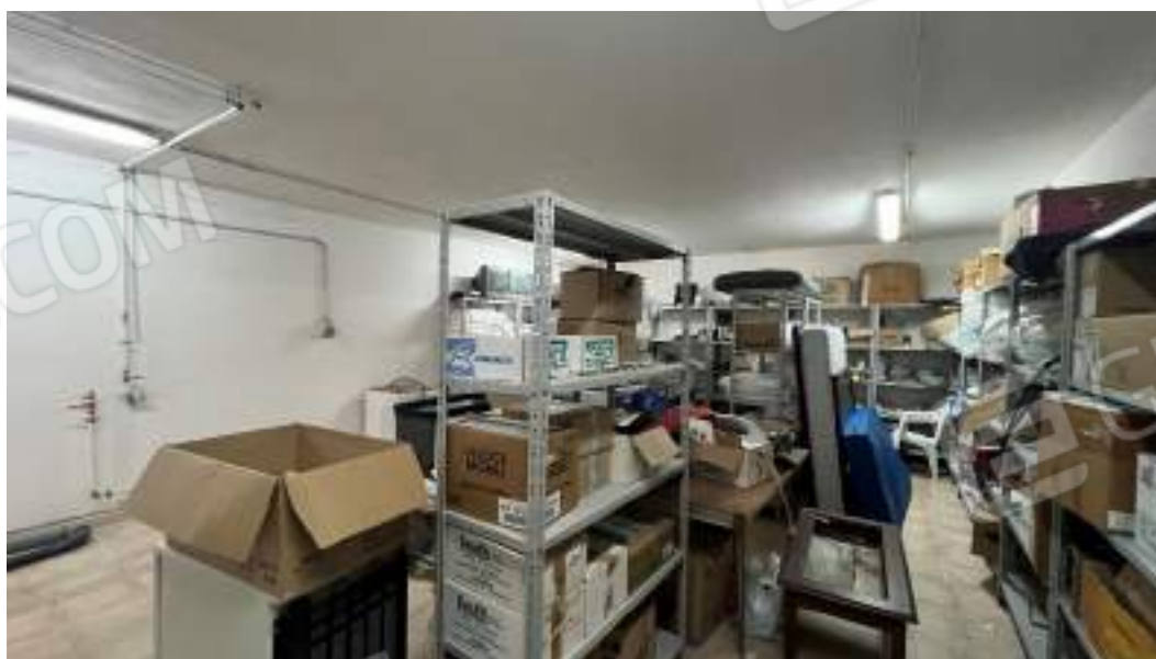
Figura 10 – Viste interne del fabbricato – piano interrato