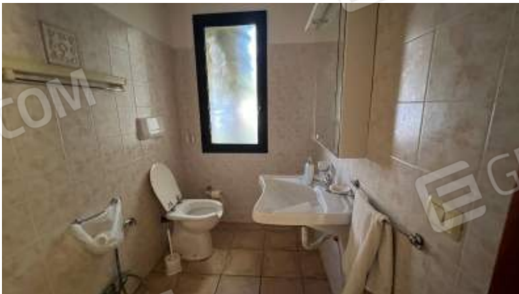
Figura 26 – Viste interne del fabbricato – piano terra