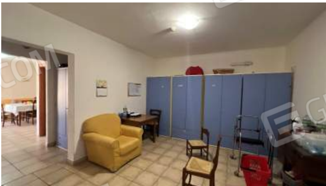
Figura 44 – Viste interne del fabbricato – piano primo