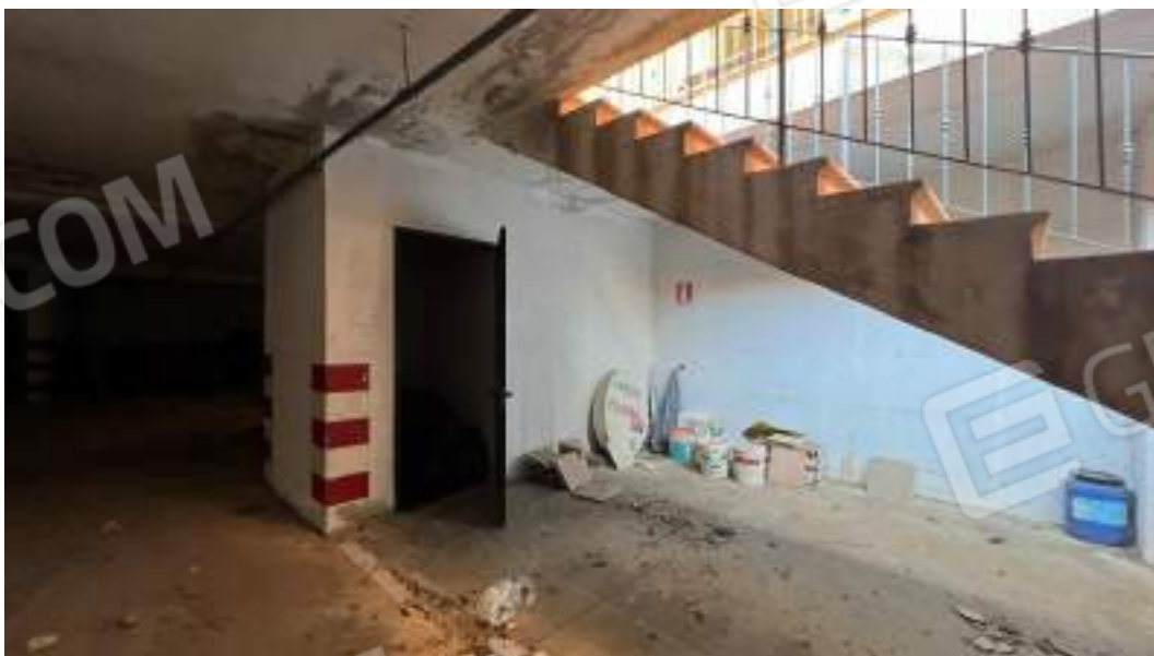
Figura 16 – Viste interne del fabbricato – piano interrato