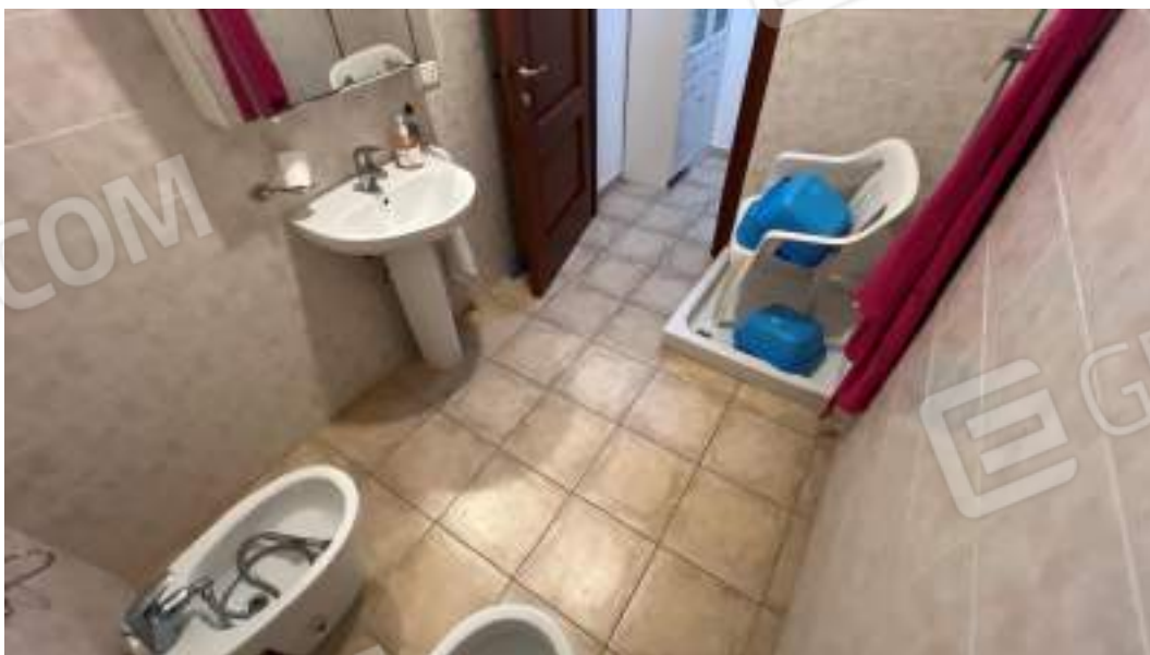
Figura 45 – Viste interne del fabbricato – piano primo