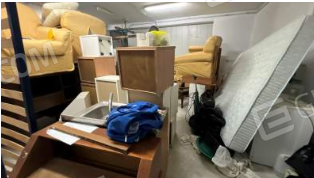
Figura 15 – Viste interne del fabbricato – piano interrato