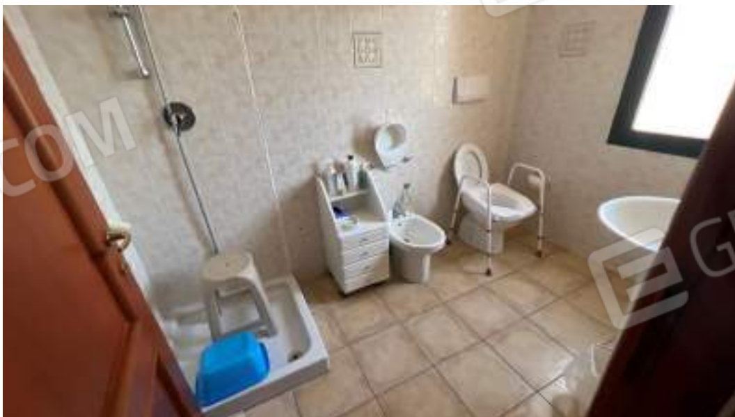
Figura 47 – Viste interne del fabbricato – piano primo