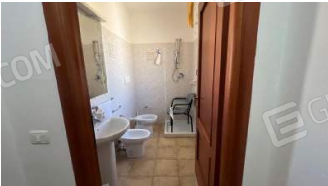
Figura 37 – Viste interne del fabbricato – piano primo