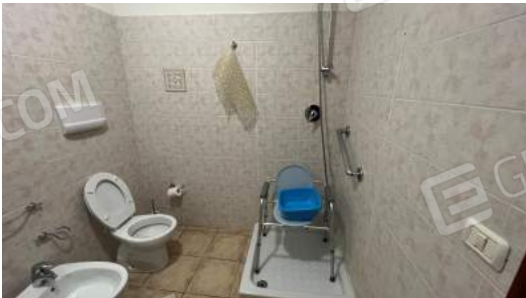
Figura 21 – Viste interne del fabbricato – piano terra