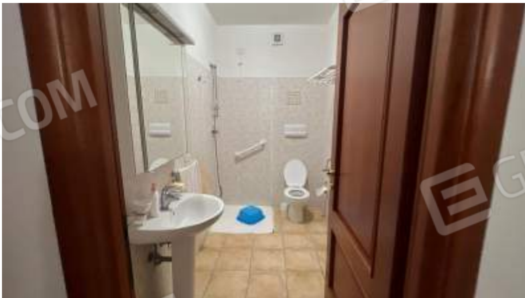
Figura 41 – Viste interne del fabbricato – piano primo