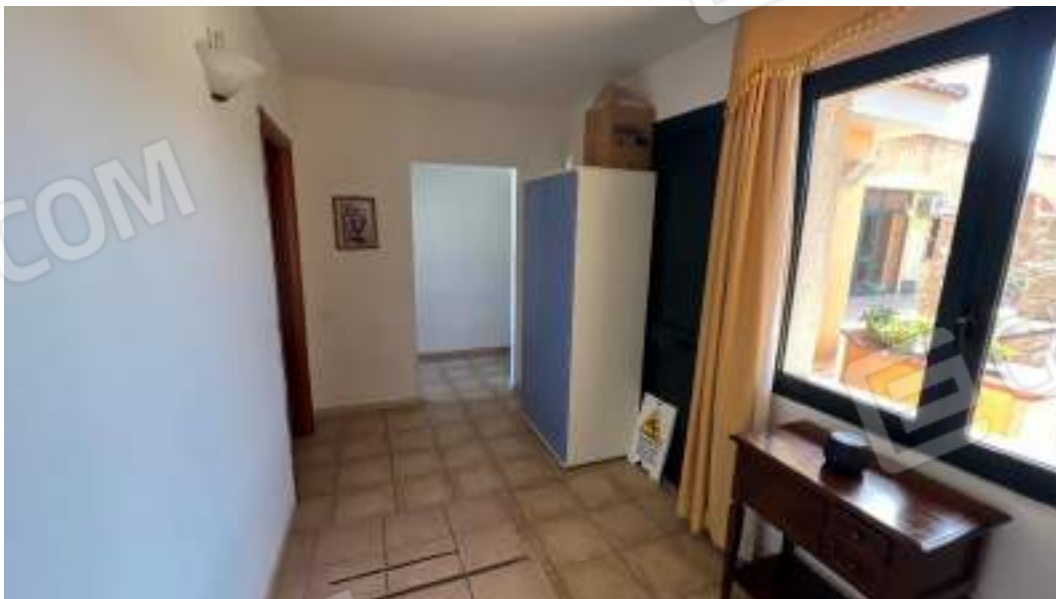
Figura 38 – Viste interne del fabbricato – piano primo