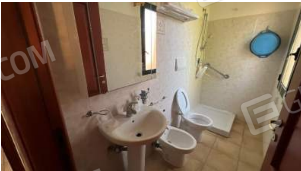
Figura 32 – Viste interne del fabbricato – piano primo