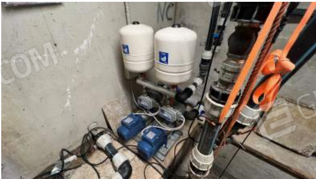
Figura 8 – Viste interne del fabbricato – piano interrato