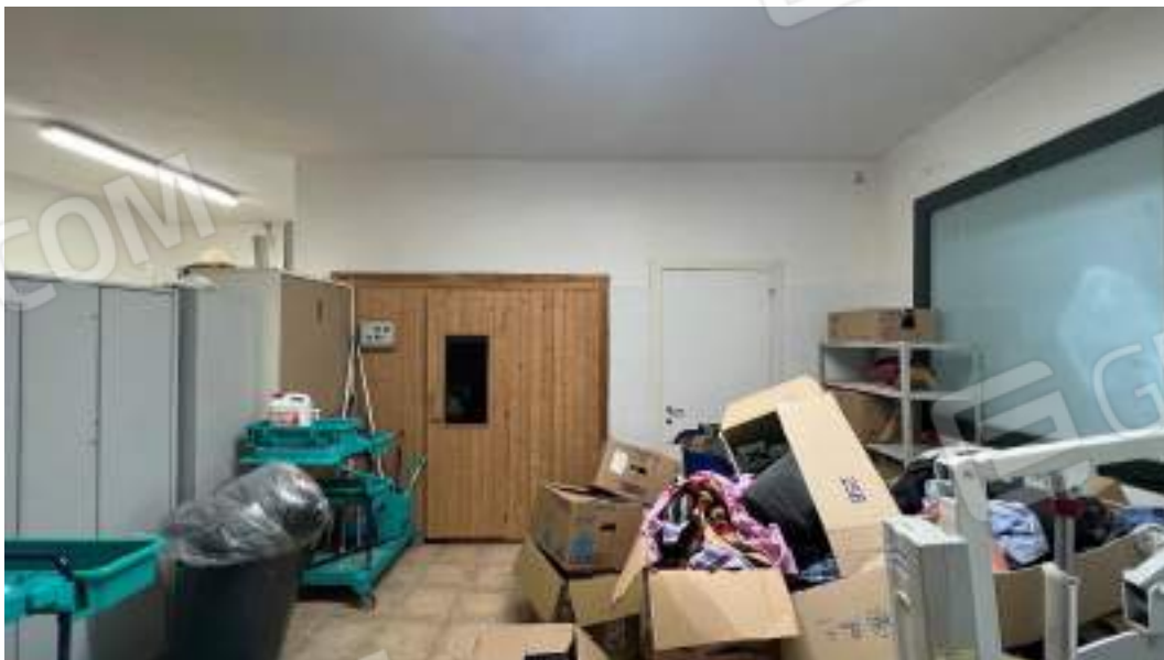
Figura 4 – Viste interne del fabbricato – piano interrato