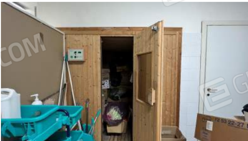
Figura 5 – Viste interne del fabbricato – piano interrato