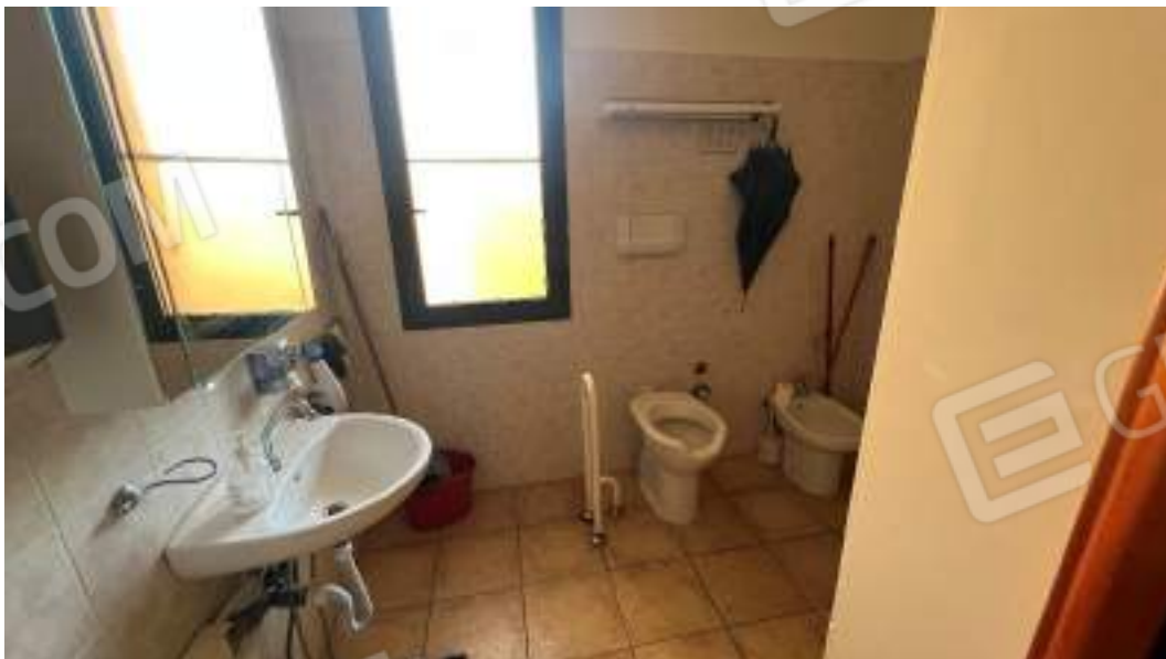
Figura 19 – Viste interne del fabbricato – piano terra