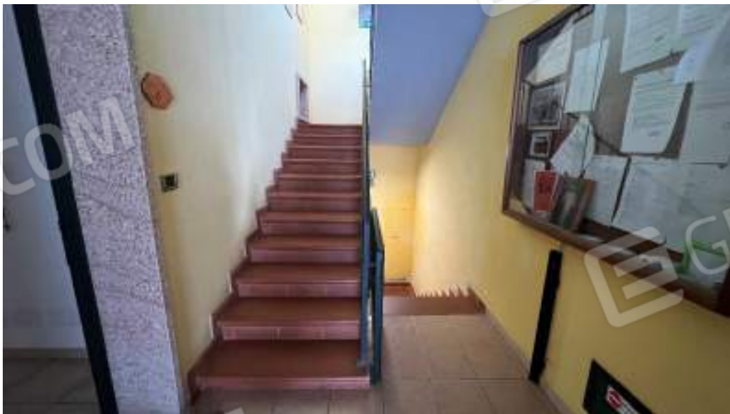
Figura 1 – Viste del percorso di accesso dal piano terra al piano interrato