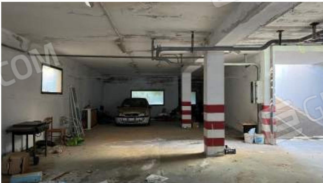
Figura 11 – Viste interne del fabbricato – piano interrato