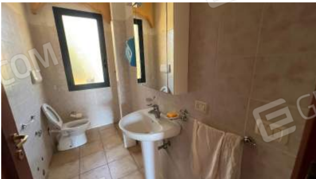
Figura 31 – Viste interne del fabbricato – piano primo