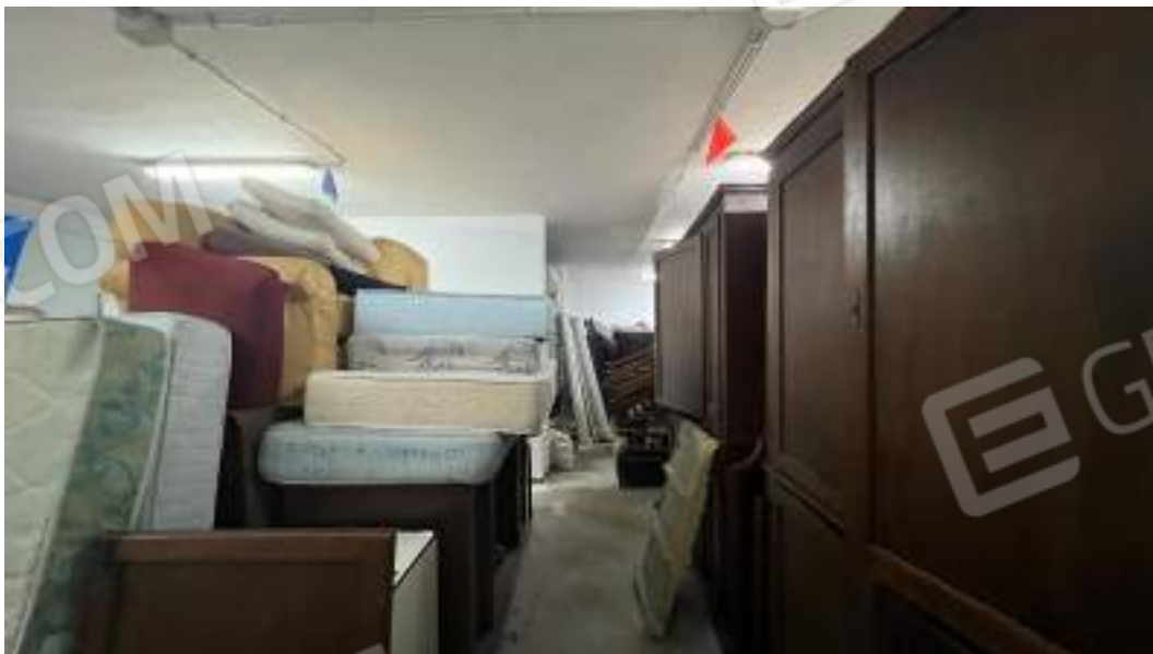
Figura 14 – Viste interne del fabbricato – piano interrato