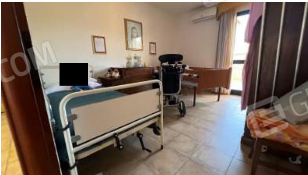
Figura 40 – Viste interne del fabbricato – piano primo