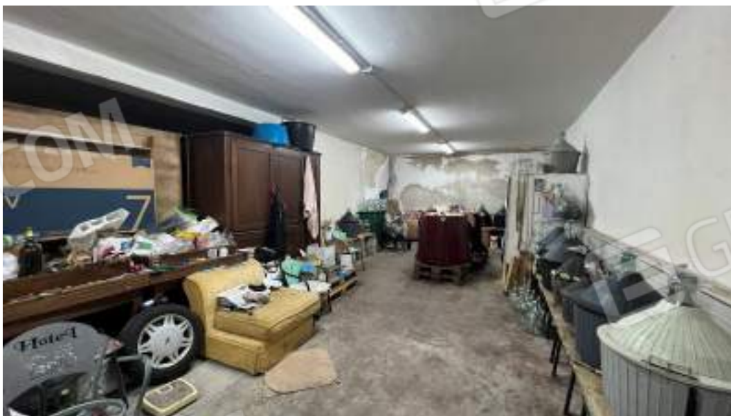
Figura 12 – Viste interne del fabbricato – piano interrato