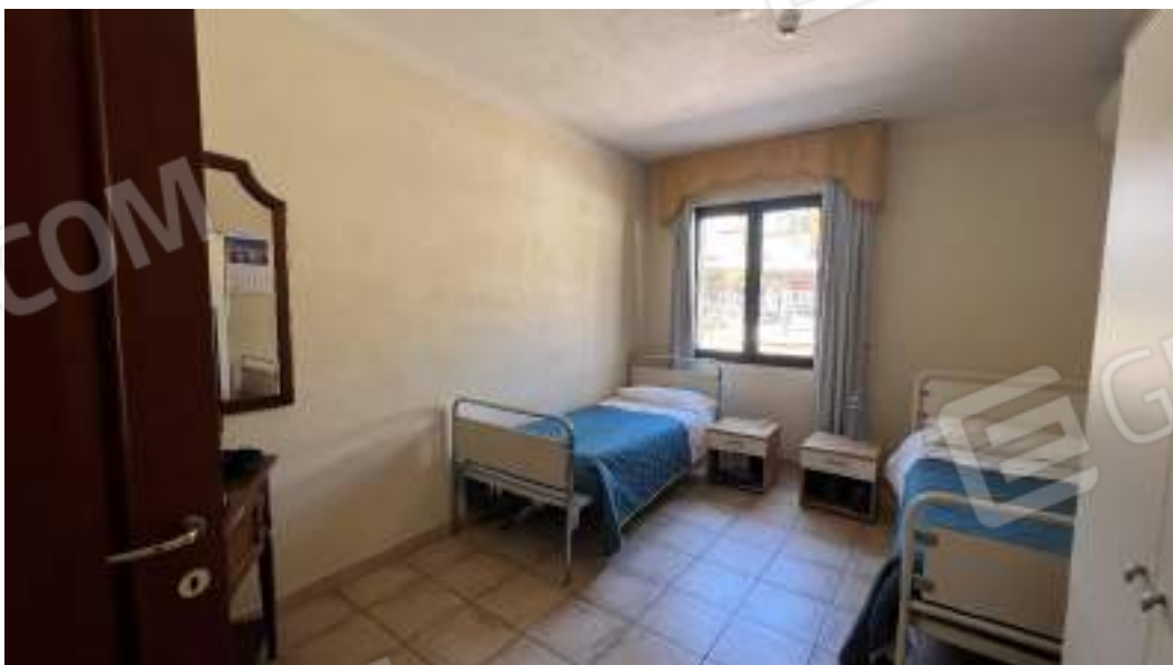
Figura 20 – Viste interne del fabbricato – piano terra