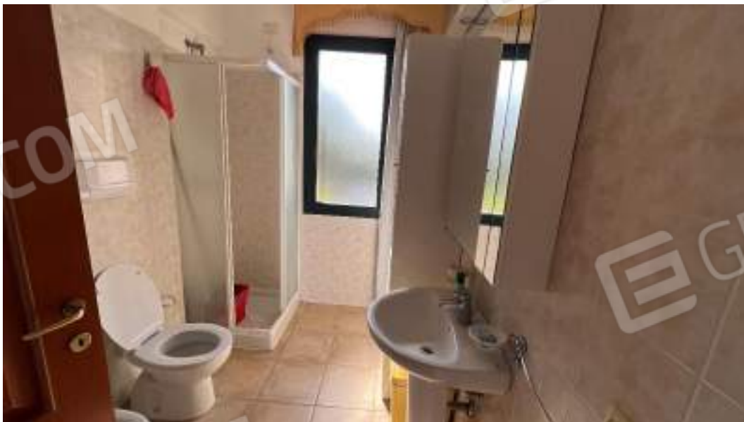
Figura 28 – Viste interne del fabbricato – piano primo