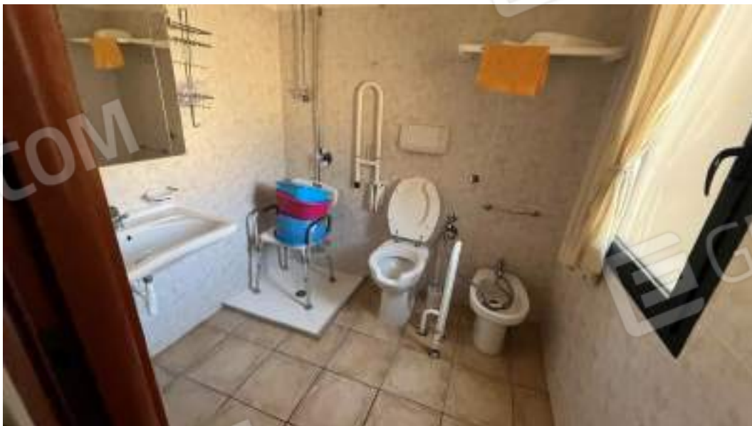
Figura 18 – Viste interne del fabbricato – piano terra