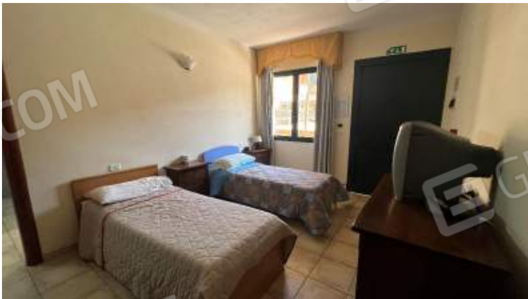
Figura 23 – Viste interne del fabbricato – piano terra