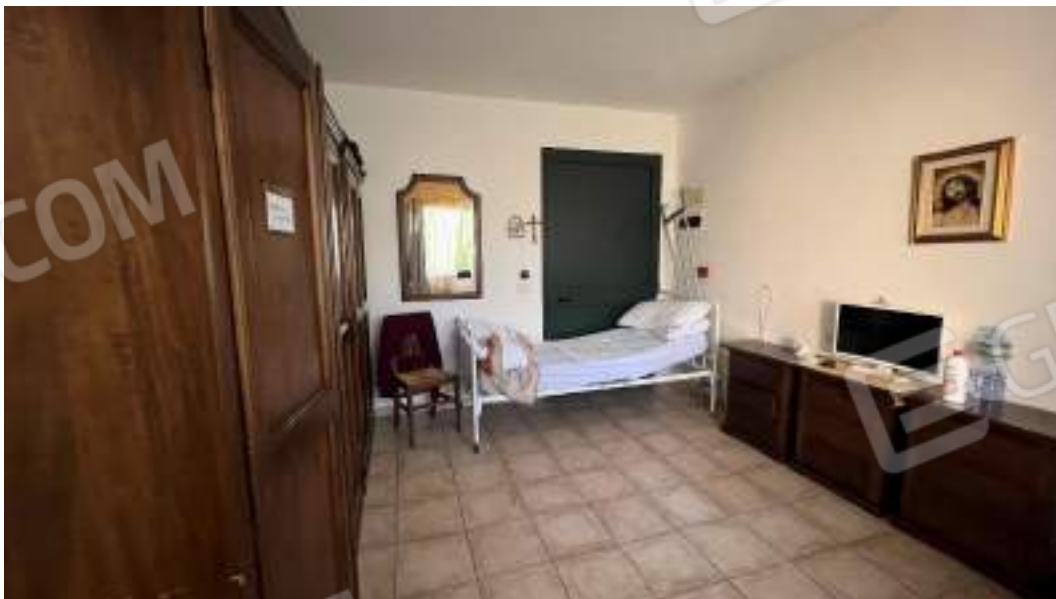
Figura 33 – Viste interne del fabbricato – piano primo