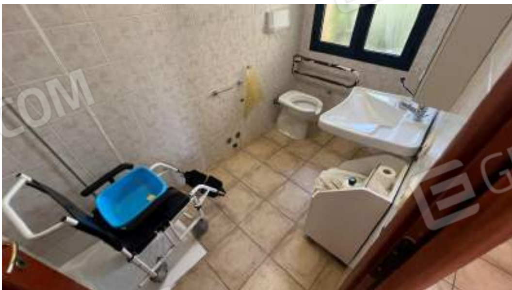
Figura 34 – Viste interne del fabbricato – piano primo