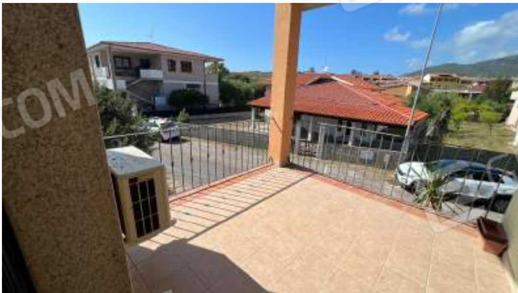
Figura 30 – Viste interne del fabbricato – piano primo