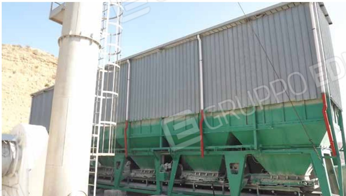
Foto.36 - Impianto di produzione di conglomerato bituminoso ed elementi strumentali all'attività dello stesso.