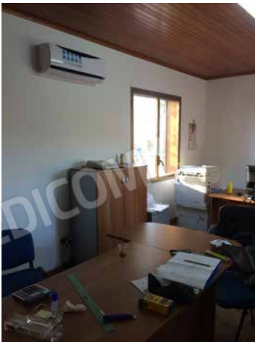
Foto.54 - Corpi di fabbrica comunicanti adibiti ad ufficio.