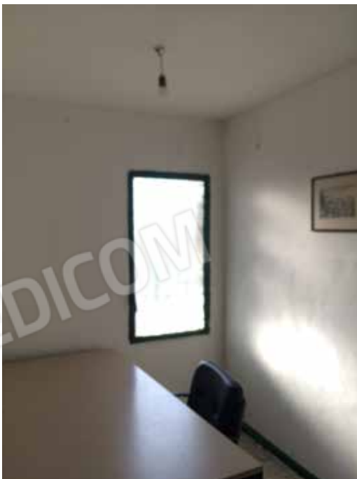
Foto.62 - Corpi di fabbrica comunicanti adibiti ad ufficio.