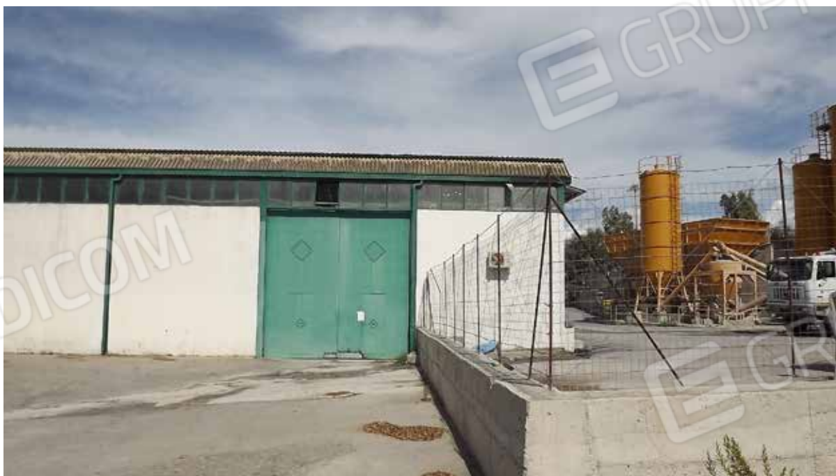
Foto.10 - Impianto di produzione di conglomerato bituminoso, ingresso al capannone adibito a deposito.