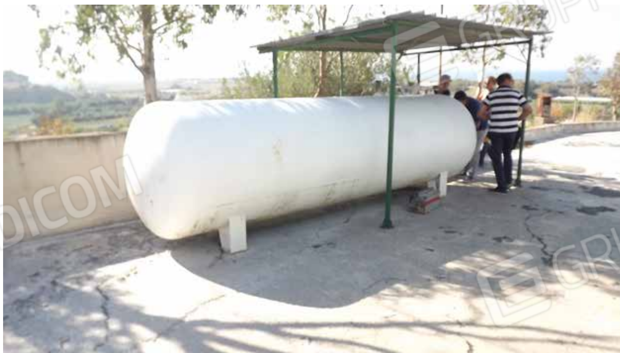
Foto.37 - Impianto di produzione di conglomerato bituminoso ed elementi strumentali all'attività dello stesso.