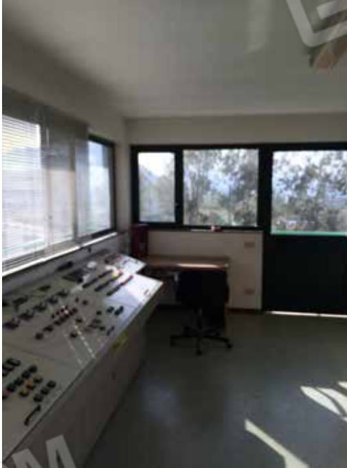
Foto.31 -Cabina di comando dell'impianto.