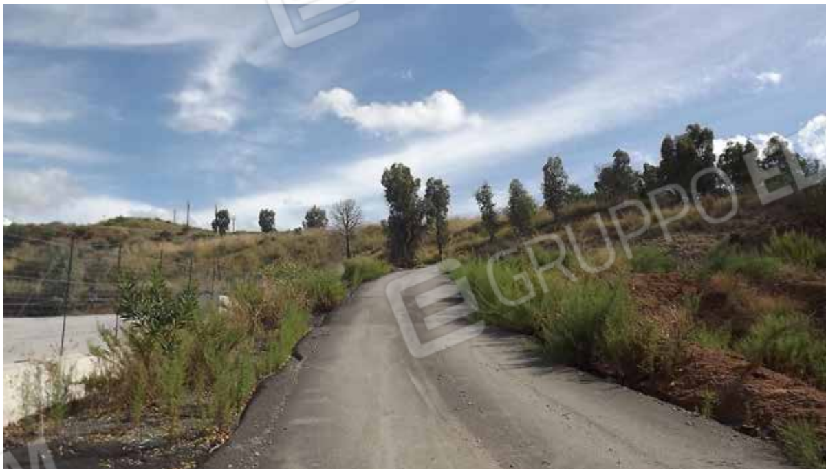
Foto.7 - Impianto di produzione di conglomerato bituminoso, area di pertinenza.

- TRIBUNALE DI TERMINI IMERESE - - SEZIONE FALLIMENTARE - Procedura Fallimentare n. 25/16 [REDACTED] s.r.l. G.E.: Dott.ssa Emanuela Rosaria Piazza Stimatore: Arch. Anna Graziano - ALLEGATO FOTOGRAFICO -