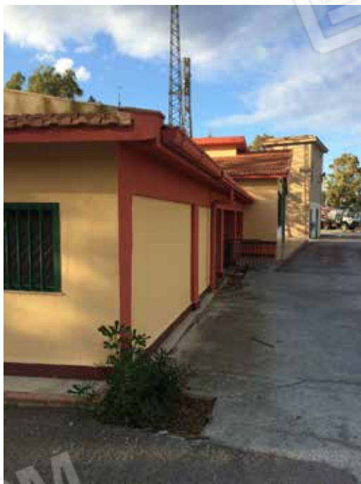
Foto.48 - Corpi di fabbrica comunicanti adibiti ad ufficio.