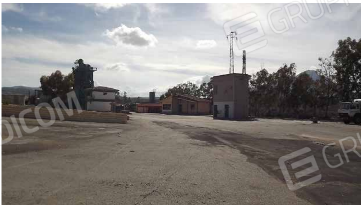
Foto.2 - Impianto di produzione di conglomerato bituminoso, area di pertinenza.