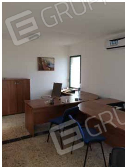
Foto.67 - Corpi di fabbrica comunicanti adibiti ad ufficio.