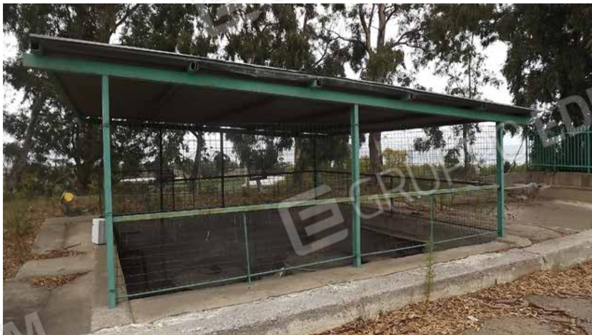
Foto.42 - Impianto di raccolta delle acque piovane in disuso.