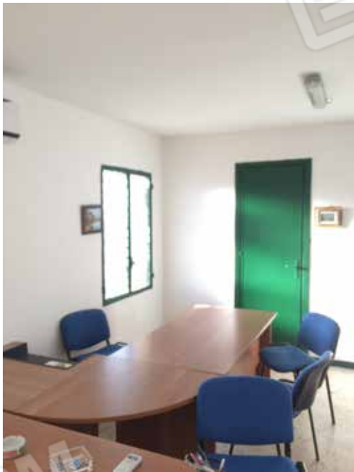
Foto.68 - Corpi di fabbrica comunicanti adibiti ad ufficio.