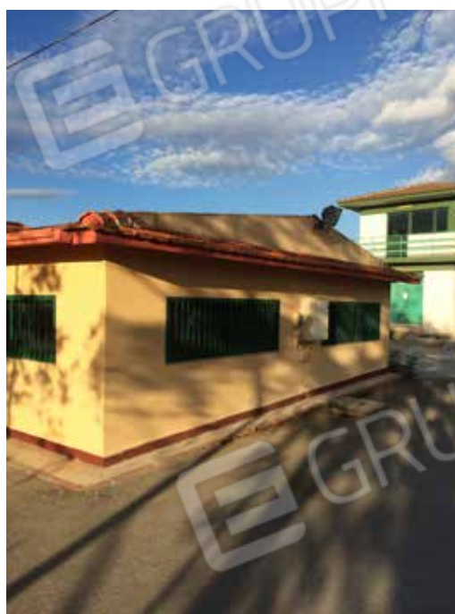
Foto.51 - Corpi di fabbrica comunicanti adibiti ad ufficio.