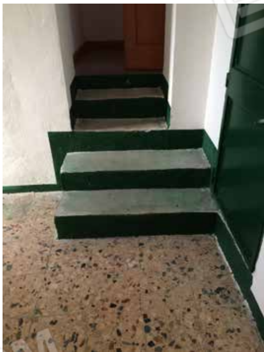
Foto.64 - Corpi di fabbrica comunicanti adibiti ad ufficio.