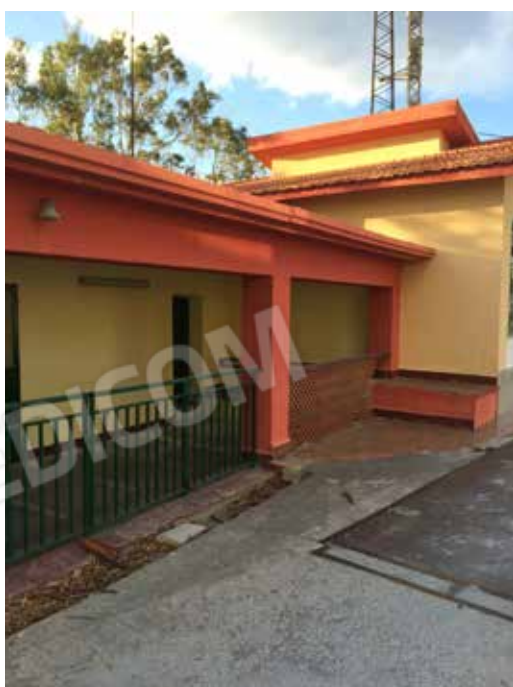
Foto.50 - Corpi di fabbrica comunicanti adibiti ad ufficio.