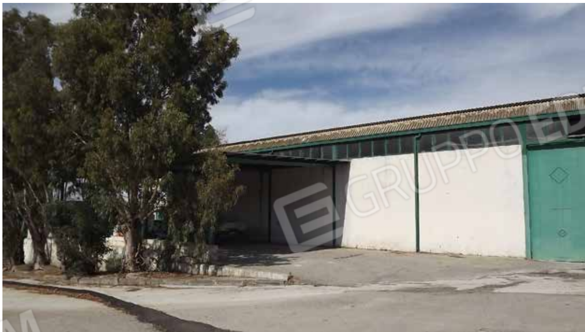
Foto.9 - Impianto di produzione di conglomerato bituminoso, area di pertinenza.