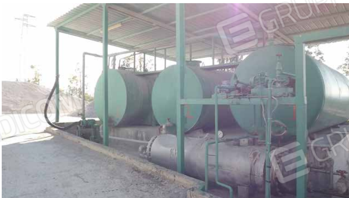
Foto.35 - Impianto di produzione di conglomerato bituminoso ed elementi strumentali all'attività dello stesso.