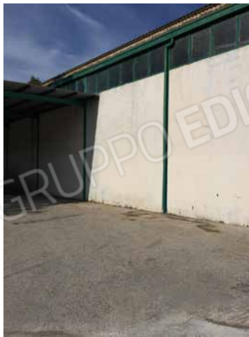
Foto.12 - Capannone adibito a deposito.