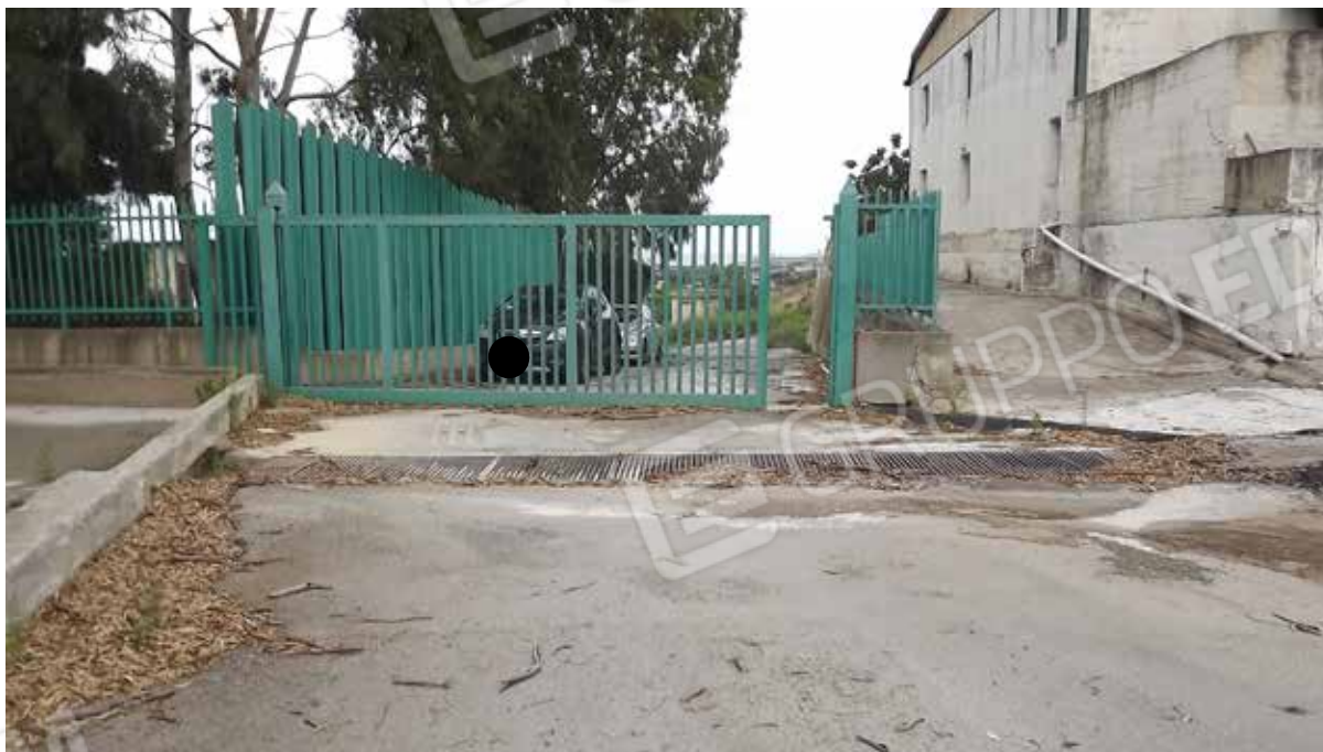
Foto.1 - Impianto di produzione di conglomerato bituminoso, area di pertinenza.