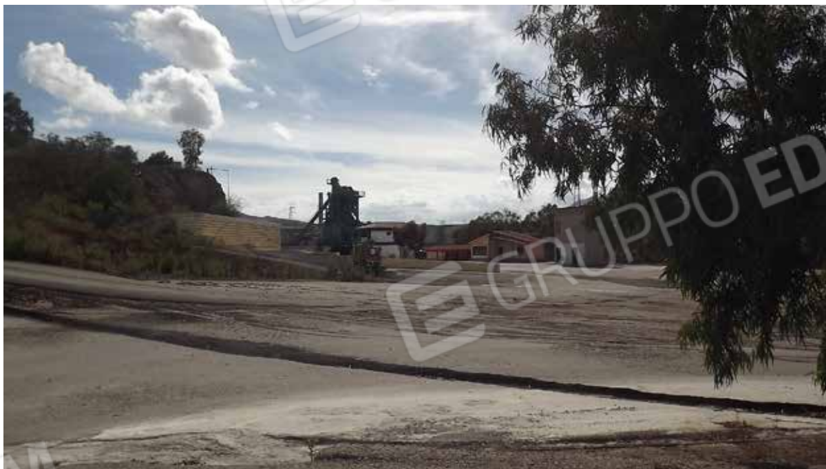
Foto.3 - Impianto di produzione di conglomerato bituminoso, area di pertinenza.