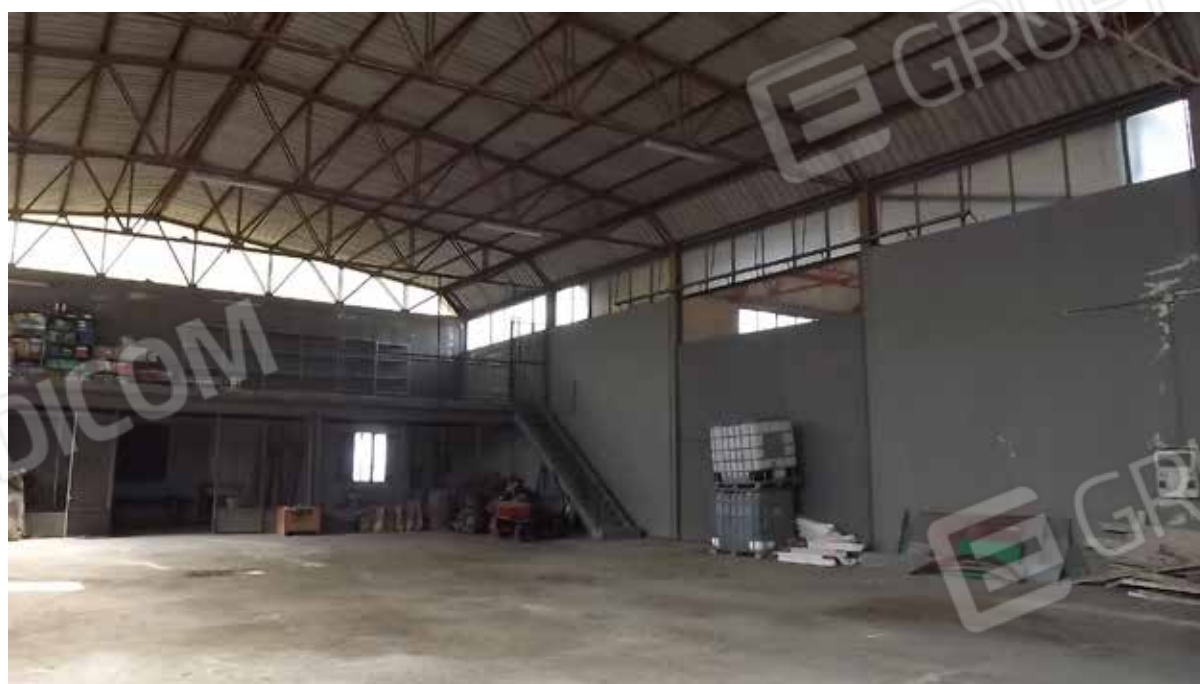
Foto.19 - Capannone adibito a deposito.