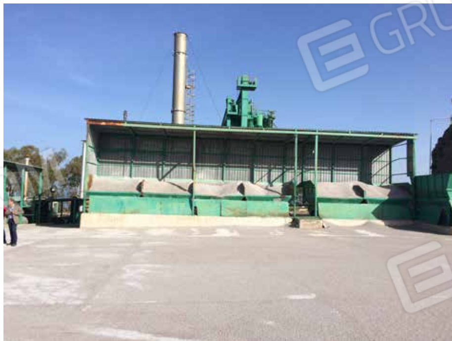
Foto.41 - Impianto di produzione di conglomerato bituminoso ed elementi strumentali all'attività dello stesso.