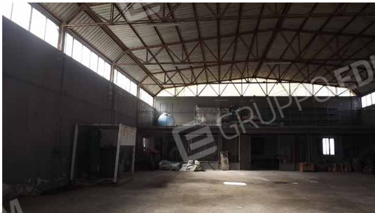
Foto.20 - Capannone adibito a deposito.