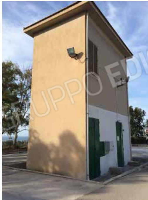
Foto.28 -Cabina Enel.