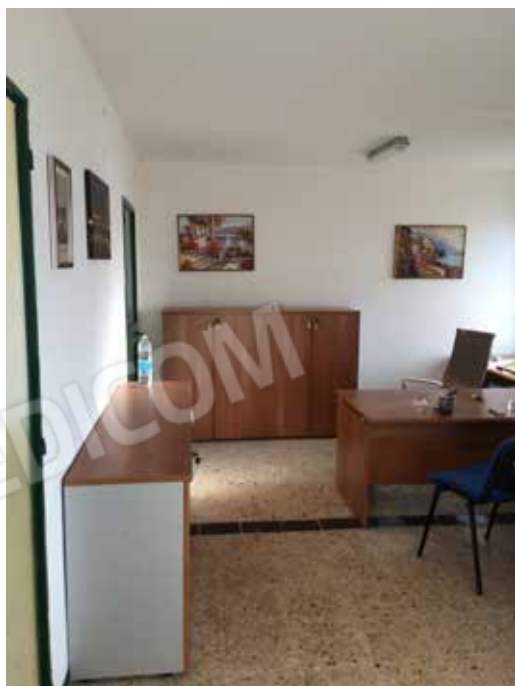
Foto.66 - Corpi di fabbrica comunicanti adibiti ad ufficio.