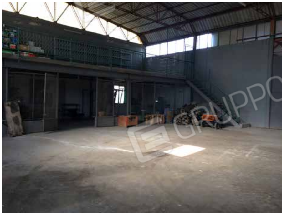
Foto.24 - Capannone adibito a deposito.