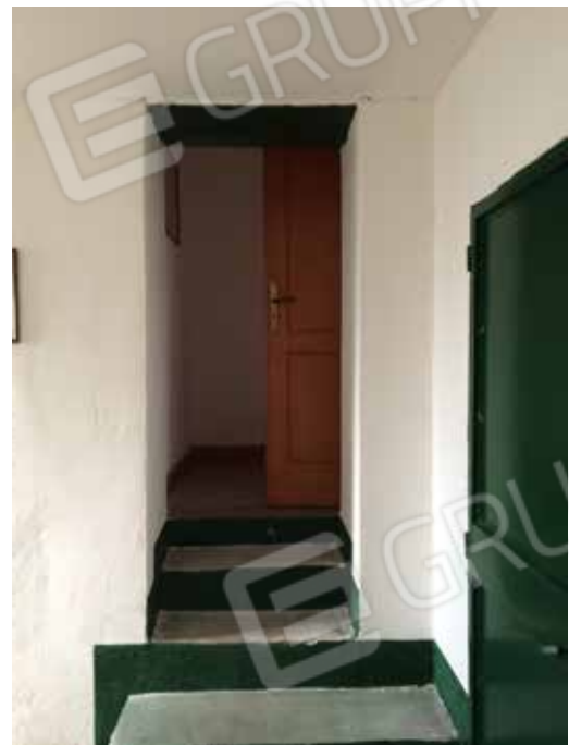
Foto.63 - Corpi di fabbrica comunicanti adibiti ad ufficio.