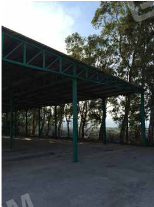
Foto.27 -Tettoia di cui si prevede la demolizione.