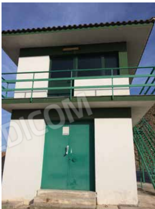
Foto.29 -Cabina di comando dell'impianto.