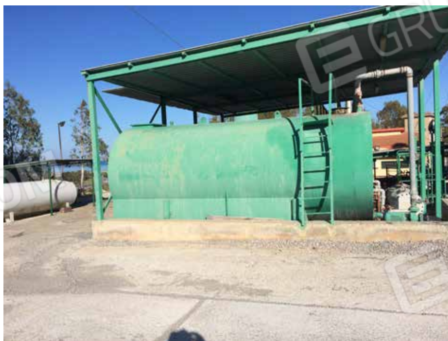
Foto.39 - Impianto di produzione di conglomerato bituminoso ed elementi strumentali all'attività dello stesso.