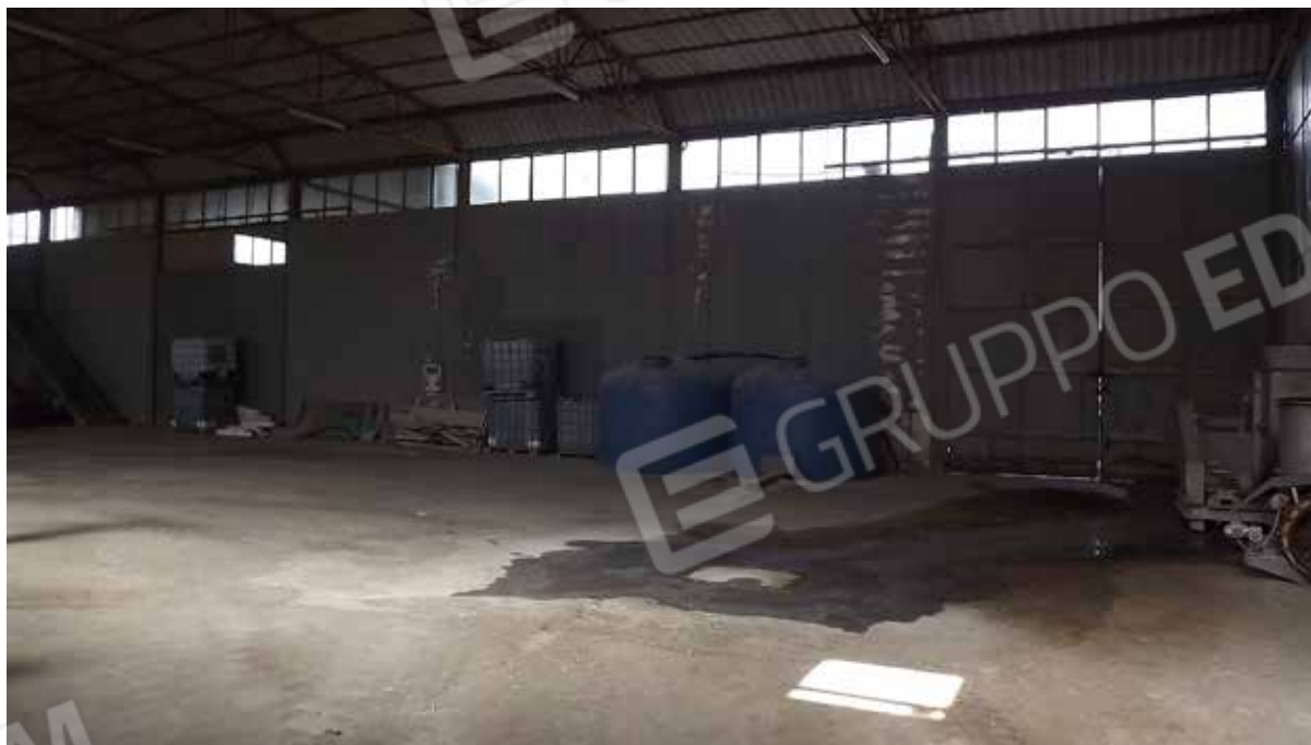
Foto.18 - Capannone adibito a deposito.