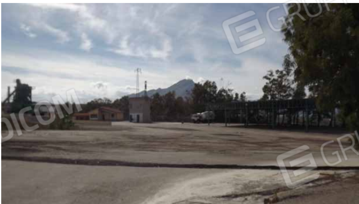
Foto.4 - Impianto di produzione di conglomerato bituminoso, area di pertinenza.