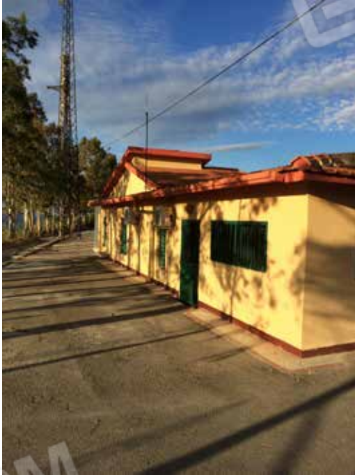
Foto.52 - Corpi di fabbrica comunicanti adibiti ad ufficio.