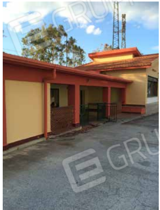
Foto.47 - Corpi di fabbrica comunicanti adibiti ad ufficio.