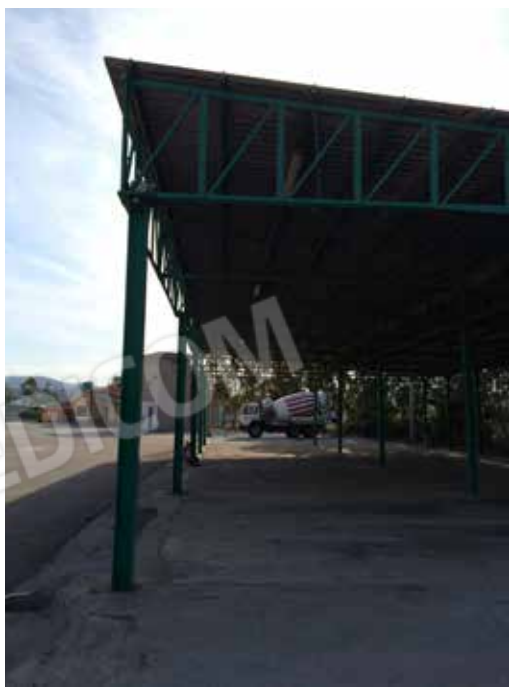
Foto.25 -Tettoia di cui si prevede la demolizione.