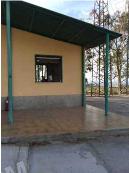
Foto.44 - Corpi di fabbrica comunicanti adibiti ad ufficio.