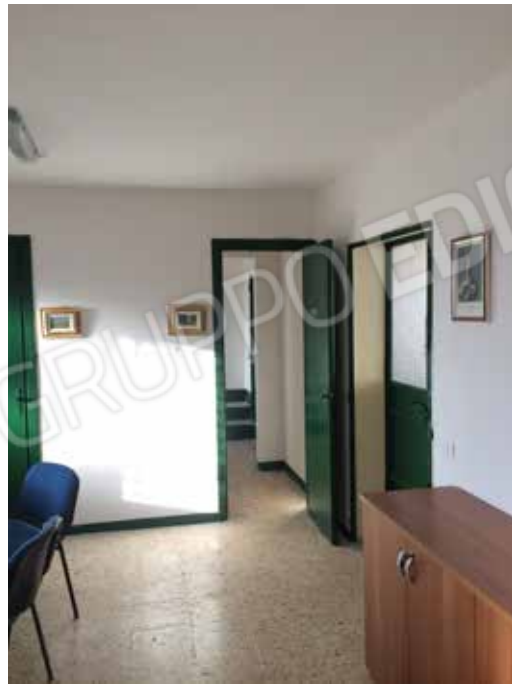
Foto.69 - Corpi di fabbrica comunicanti adibiti ad ufficio.