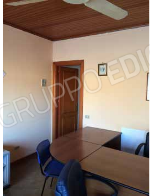
Foto.61 - Corpi di fabbrica comunicanti adibiti ad ufficio.