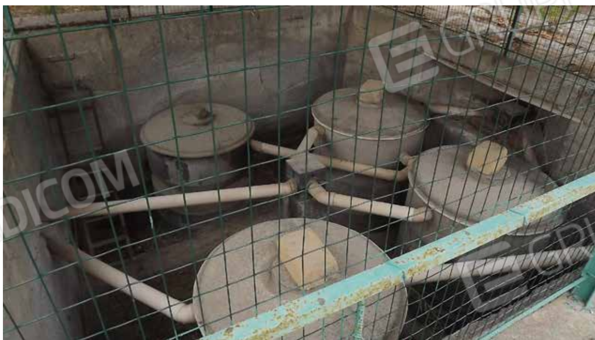
Foto.43 - Impianto di raccolta delle acque piovane in disuso.