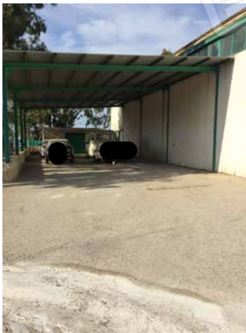
Foto.11 - Tettoia addossata al capannone di cui si prevede la demolizione.