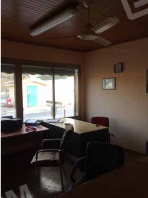
Foto.60 - Corpi di fabbrica comunicanti adibiti ad ufficio.