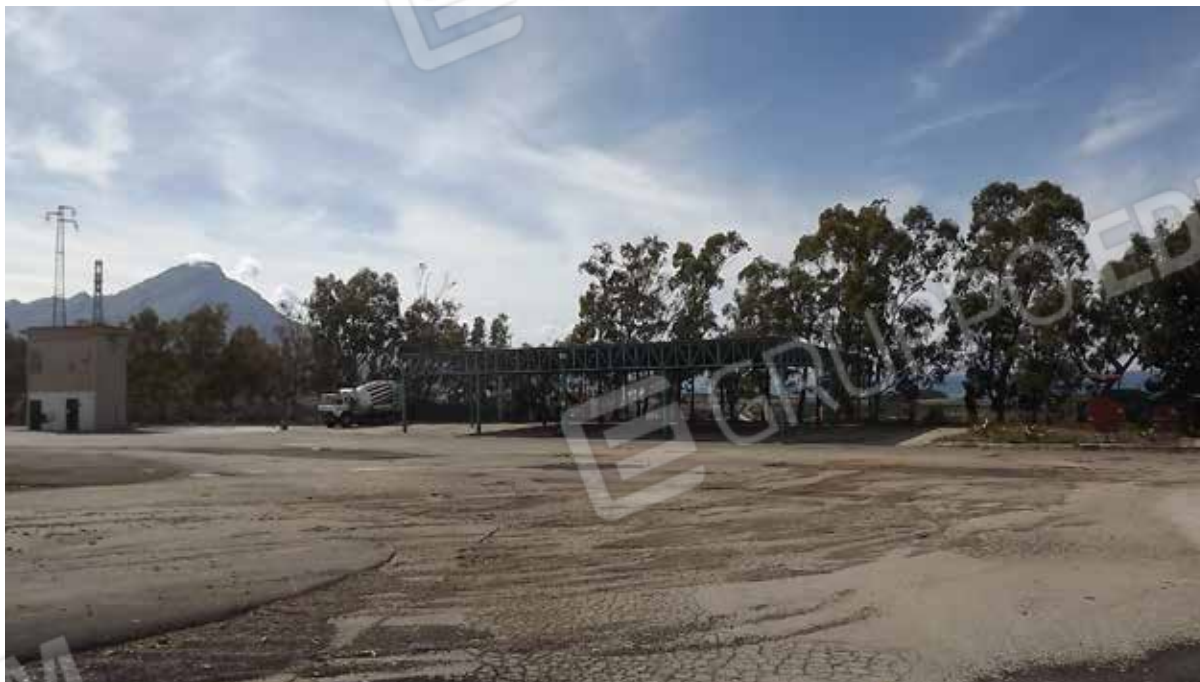
Foto.5 - Impianto di produzione di conglomerato bituminoso, area di pertinenza.