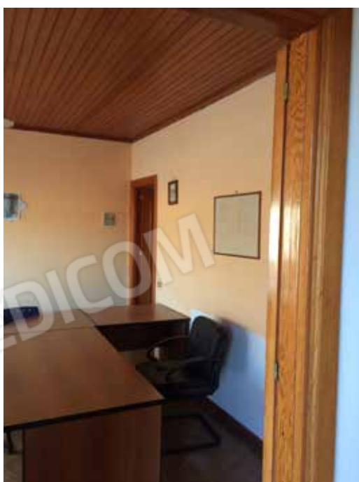
Foto.58 - Corpi di fabbrica comunicanti adibiti ad ufficio.