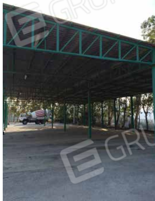
Foto.26 -Tettoia di cui si prevede la demolizione.