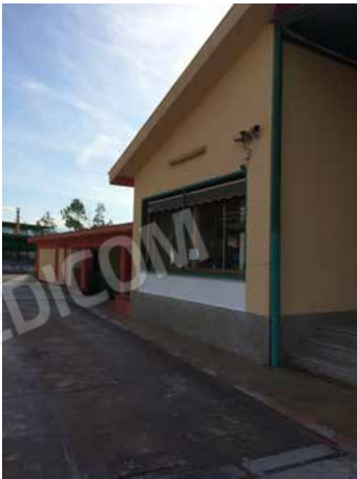
Foto.46 - Corpi di fabbrica comunicanti adibiti ad ufficio.