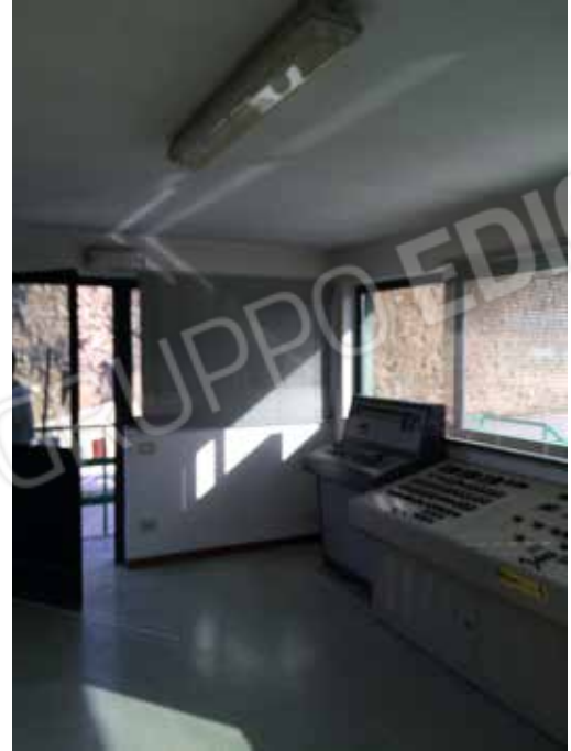
Foto.32 -Cabina di comando dell'impianto.