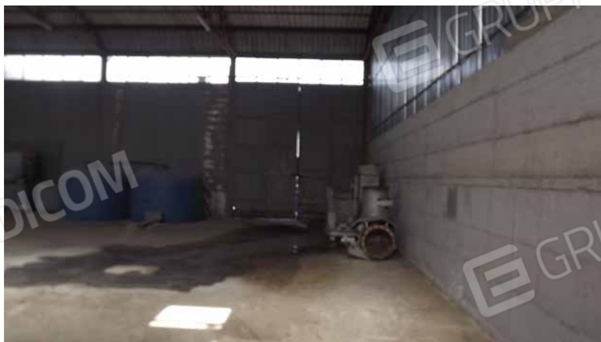
Foto.17 - Capannone adibito a deposito.