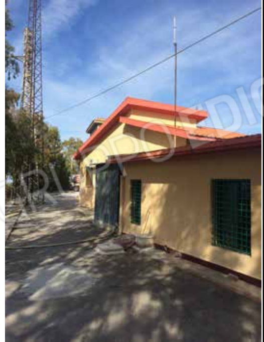
Foto.53 - Corpi di fabbrica comunicanti adibiti ad ufficio.