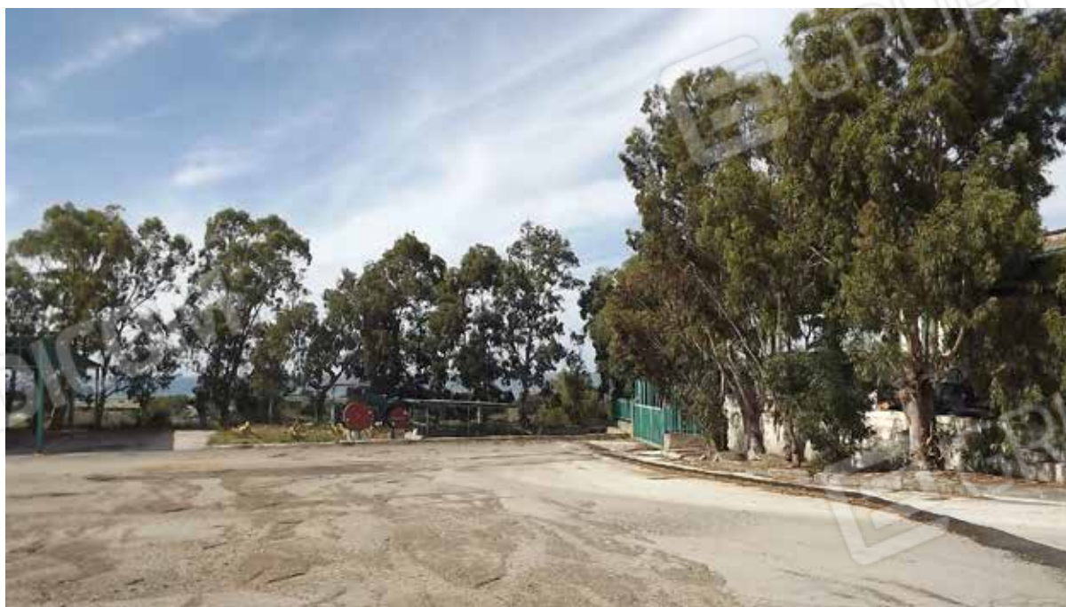
Foto.6 - Impianto di produzione di conglomerato bituminoso, area di pertinenza.