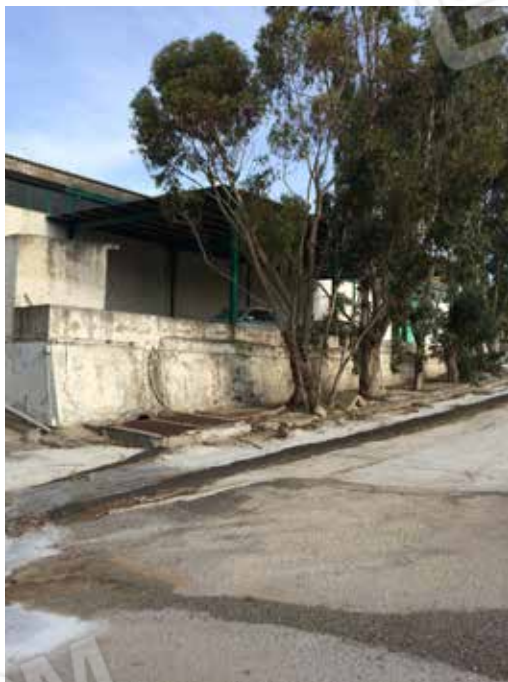
Foto.15 - Impianto di produzione di conglomerato bituminoso, area di pertinenza.