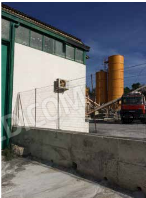
Foto.13 - Muro di confine con proprietà aliena, part. 1292, sub 4.