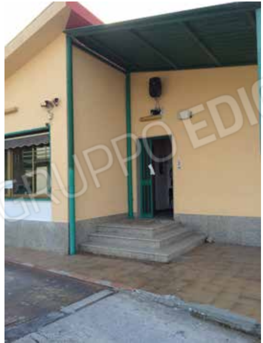
Foto.45 - Corpi di fabbrica comunicanti adibiti ad ufficio.