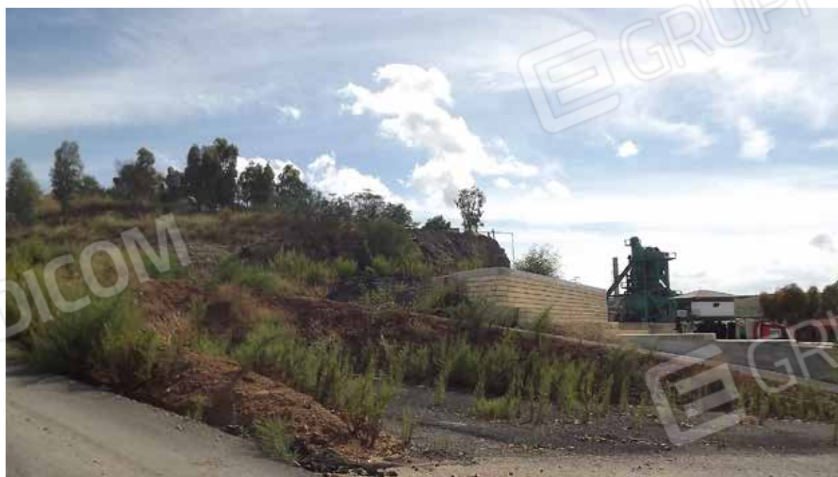
Foto.8 - Impianto di produzione di conglomerato bituminoso, area di pertinenza.