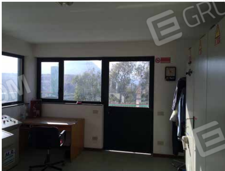
Foto.33 -Cabina di comando dell'impianto.