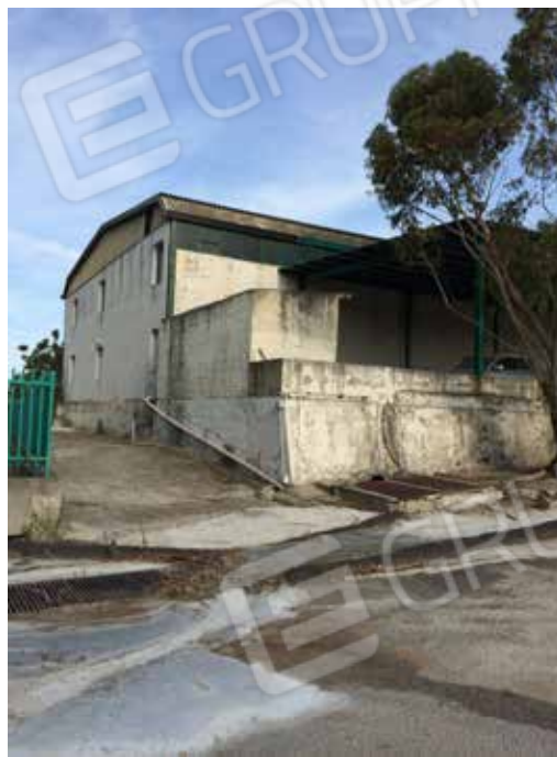
Foto.14 - Impianto di produzione di conglomerato bituminoso, area di pertinenza.