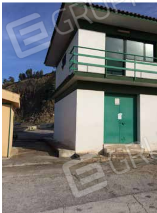
Foto.30 -Cabina di comando dell'impianto.