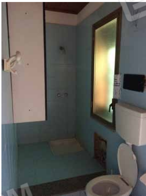
Foto.56 - Corpi di fabbrica comunicanti adibiti ad ufficio.