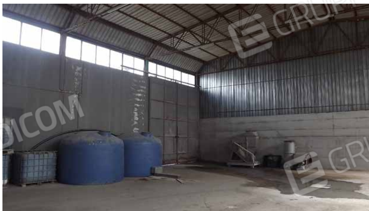
Foto.21 - Capannone adibito a deposito.