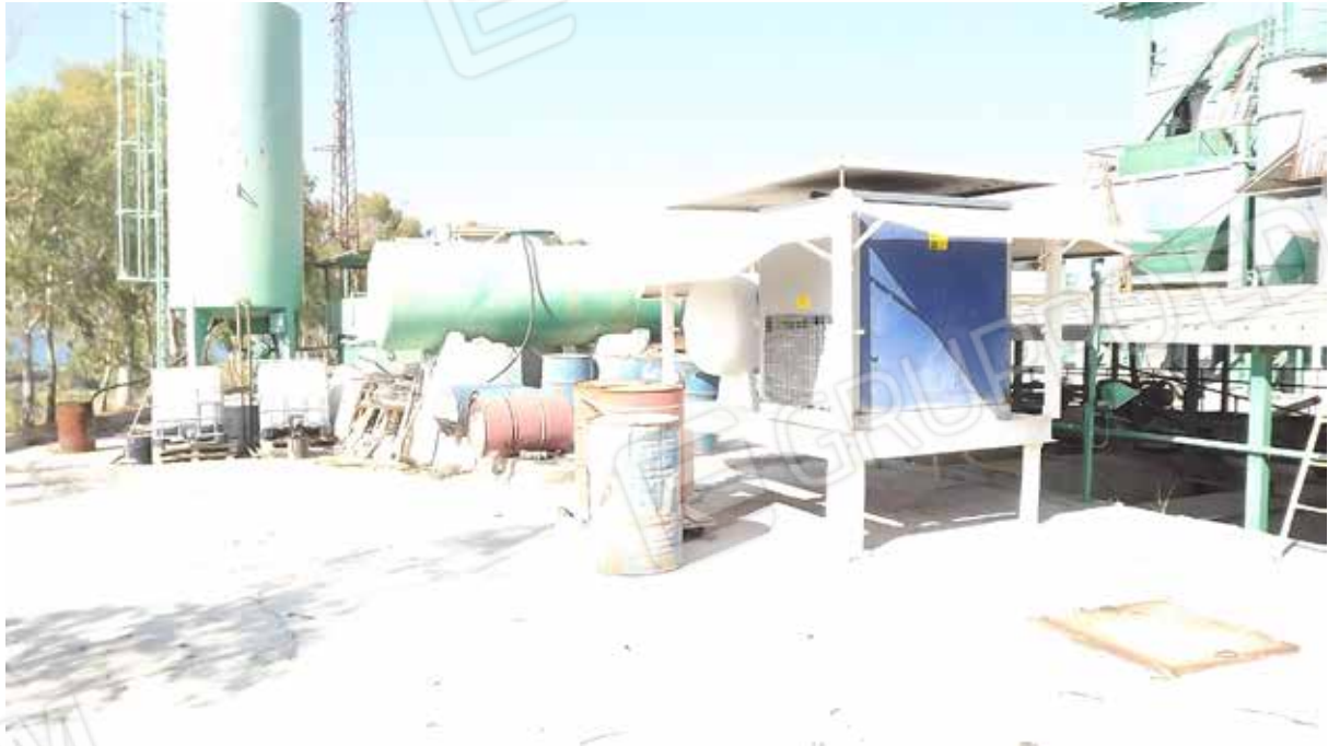
Foto.40 - Impianto di produzione di conglomerato bituminoso ed elementi strumentali all'attività dello stesso.