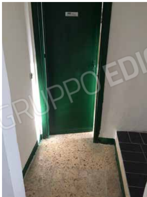
Foto.65 - Corpi di fabbrica comunicanti adibiti ad ufficio.