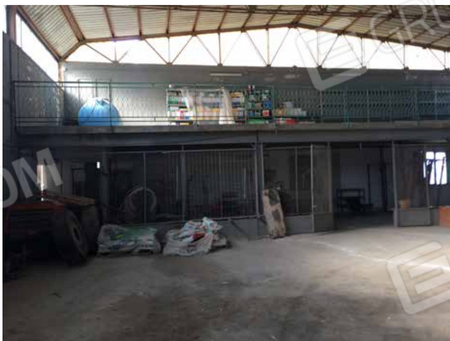
Foto.23 - Capannone adibito a deposito.