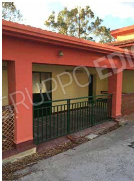
Foto.49 - Corpi di fabbrica comunicanti adibiti ad ufficio.