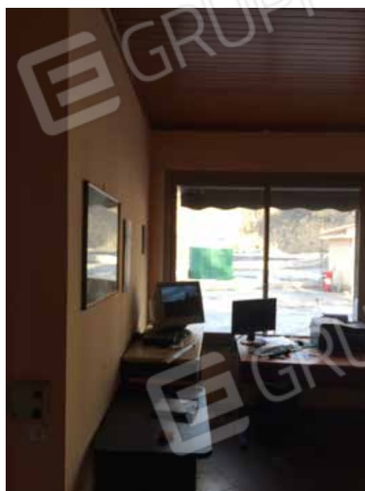
Foto.59 - Corpi di fabbrica comunicanti adibiti ad ufficio.