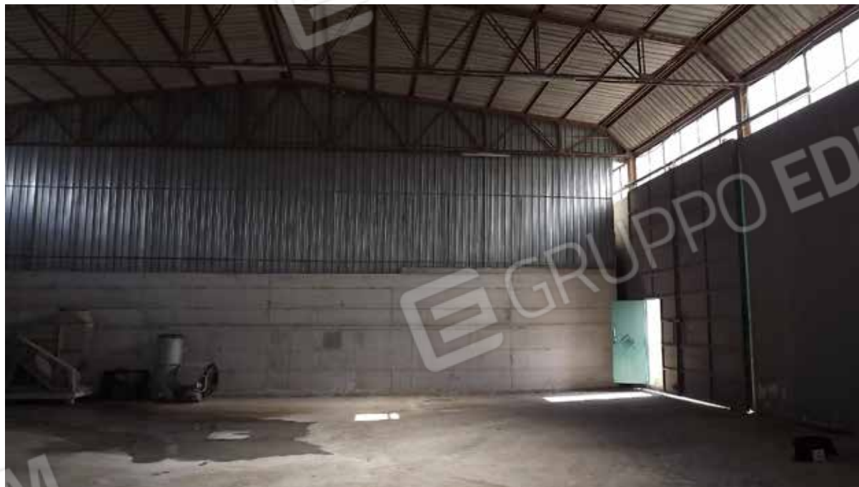
Foto.22 - Capannone adibito a deposito.