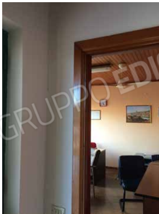
Foto.57 - Corpi di fabbrica comunicanti adibiti ad ufficio.