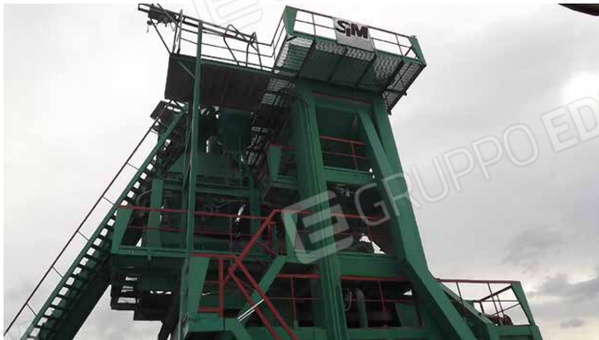
Foto.38 - Impianto di produzione di conglomerato bituminoso ed elementi strumentali all'attività dello stesso.