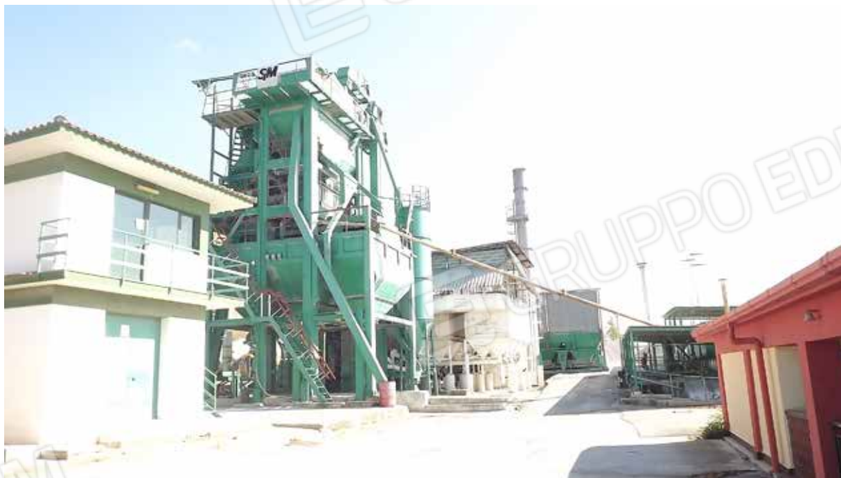
Foto.34 - Impianto di produzione di conglomerato bituminoso ed elementi strumentali all'attività dello stesso.