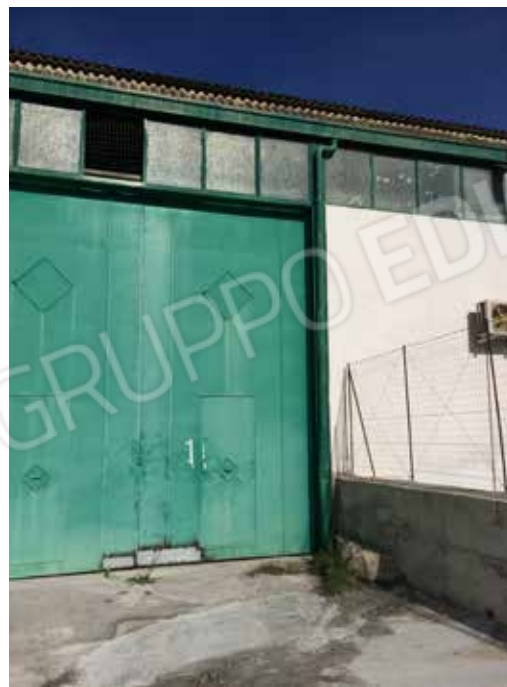
Foto.16 - Impianto di produzione di conglomerato bituminoso, area di pertinenza.