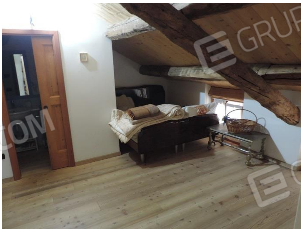
Locale al piano secondo