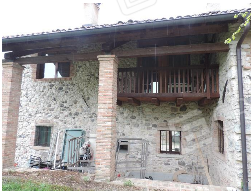
Fabbricato (Fig. 39 map.le 1093 sub 3)- lato Nord con terrazzo