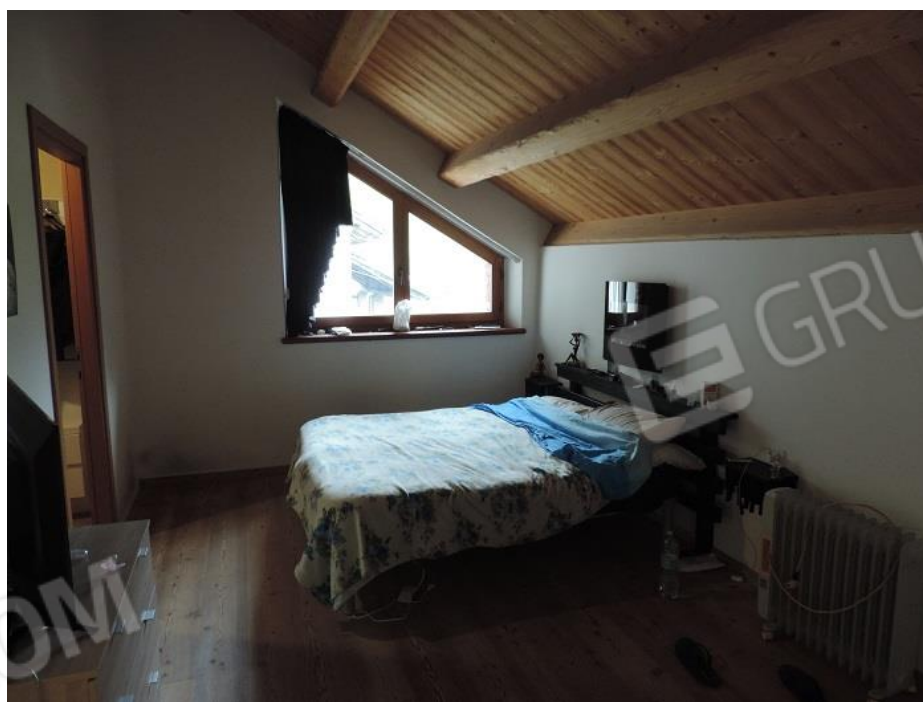
Camera al piano primo