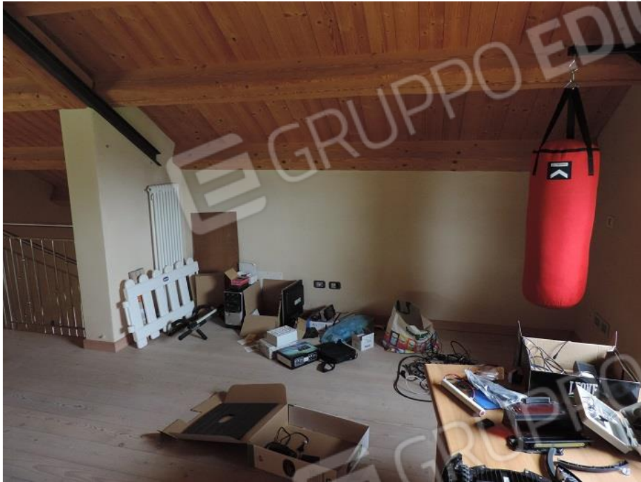
Soppalco al piano secondo