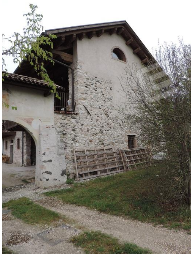
Fabbricato (Fg. 39 MAP.LE 1093 sub 3)- lato Est con accesso alla corte