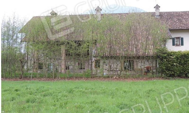
Fabbricato (Fig. 39 MAP.LE 1093 sub 3)- lato Nord