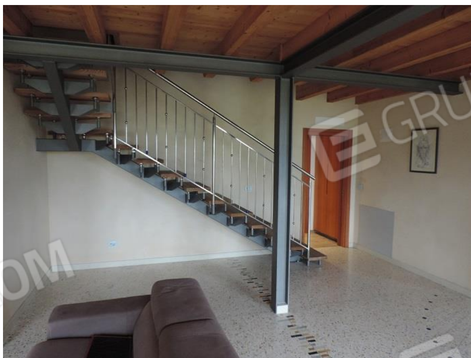
Scala per accesso al soppalco lato Ovest