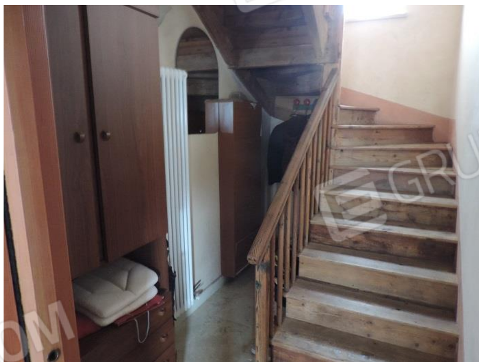
Scala in legno per accesso al piano primo e secondo