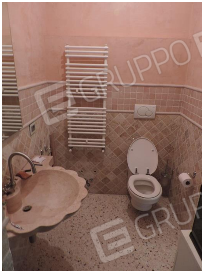
Bagno al piano primo