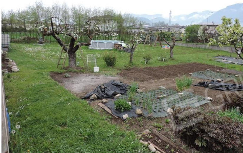
Pertinenze del map.le 1093 sub 3-4