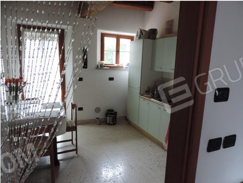
Cucina al piano terra con accesso al giardino sul lato Nord