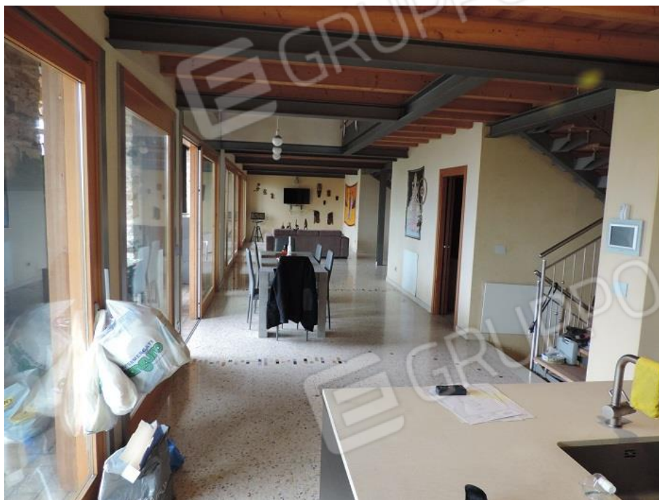
Soggiorno al P1