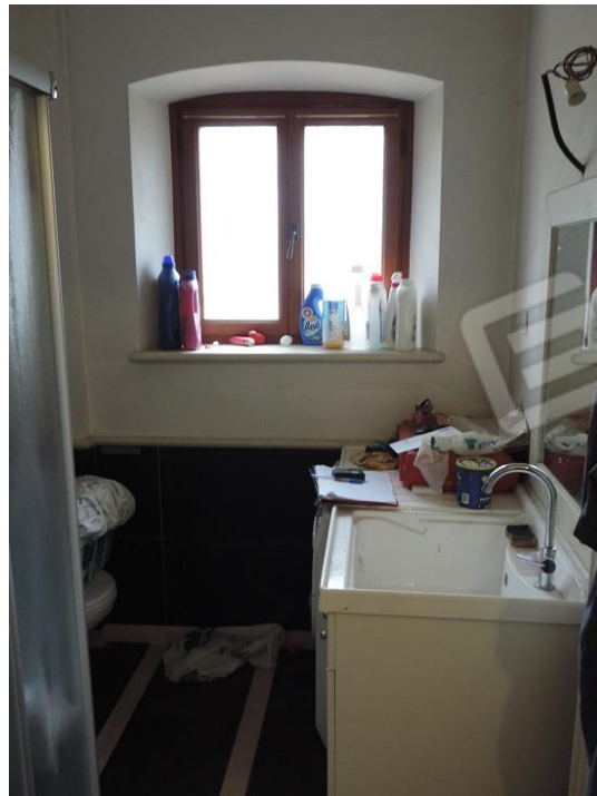
Bagno di servizio al piano terra