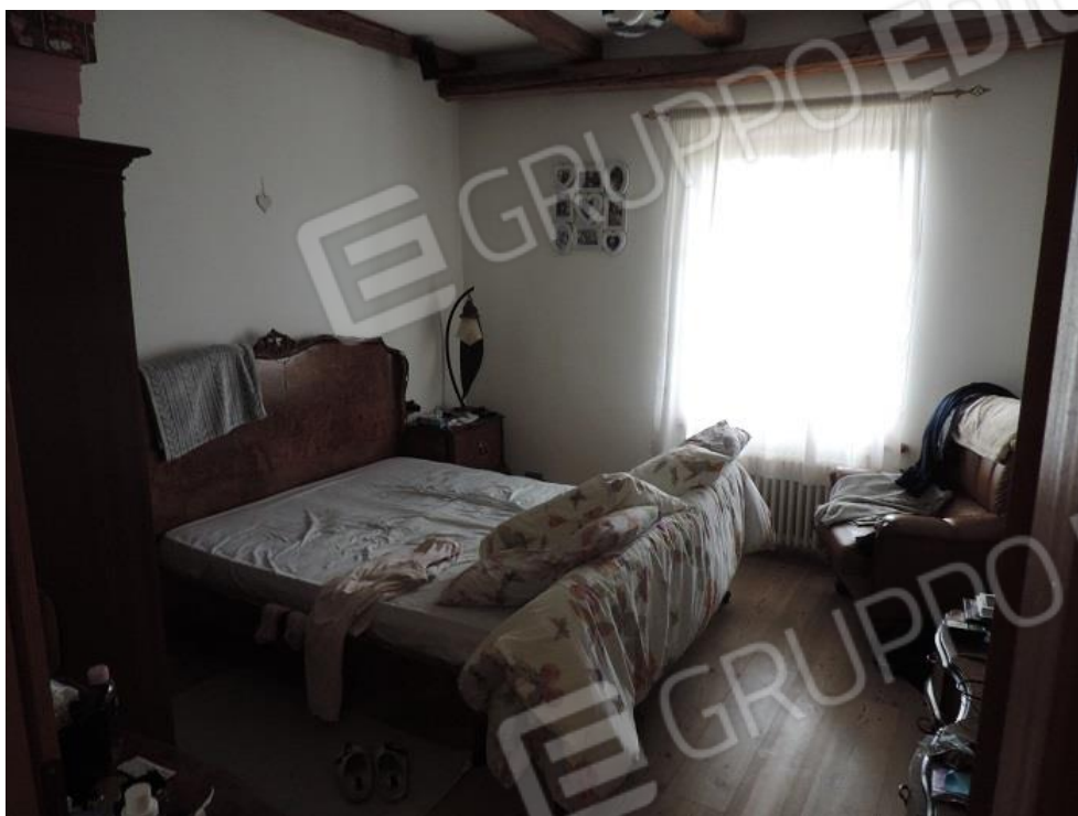
Camera al piano primo