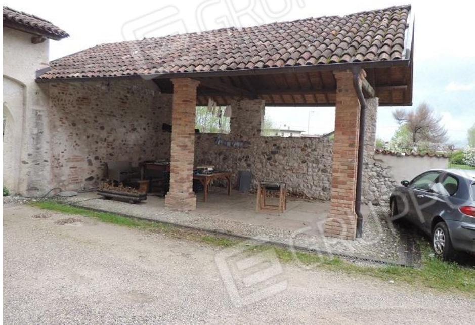
Fg 39 map.le 1093 sub 4 - tettoia -posto auto