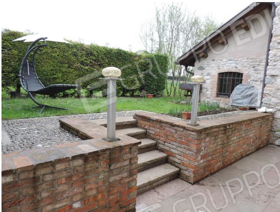
Giardino pertinenza del map.le 1093 sub 2