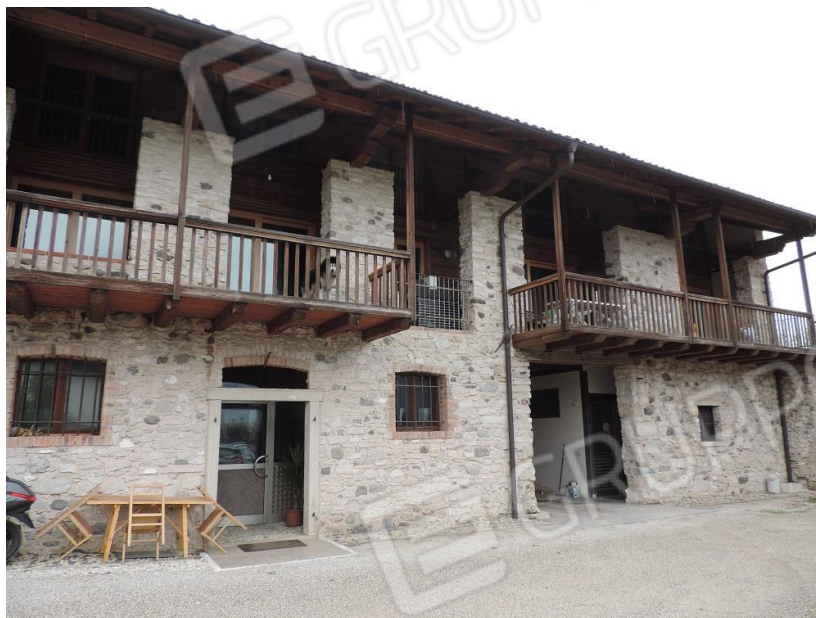
Fabbricato (Fg. 39 MAP.LE 1093 sub 3)- lato Sud