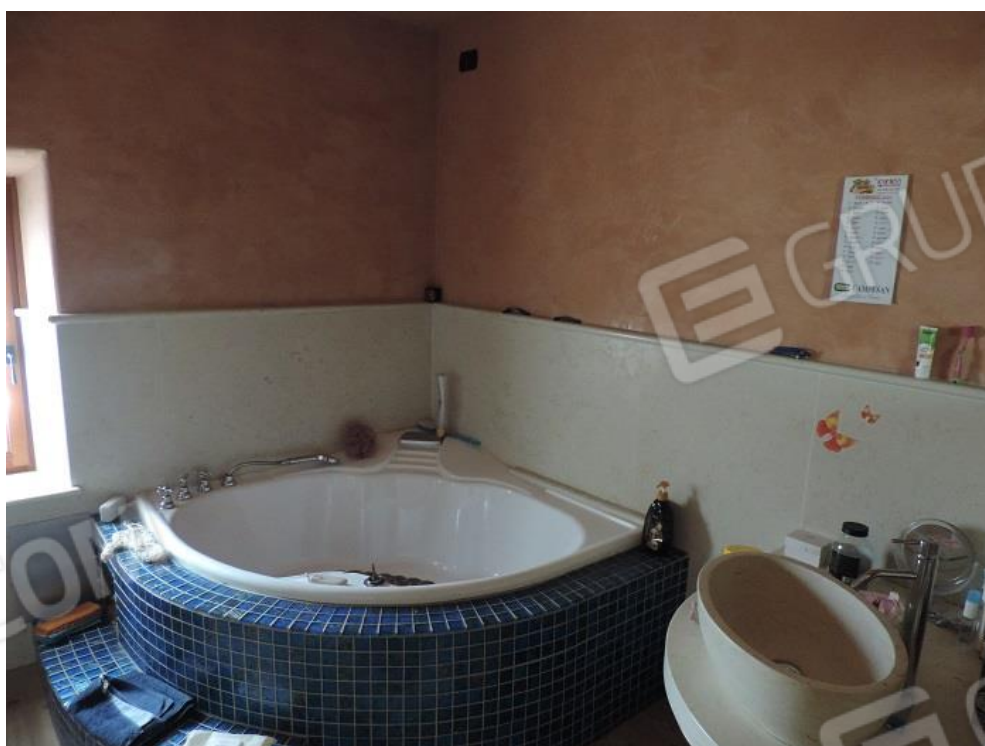
Bagno con vasca idromassaggio