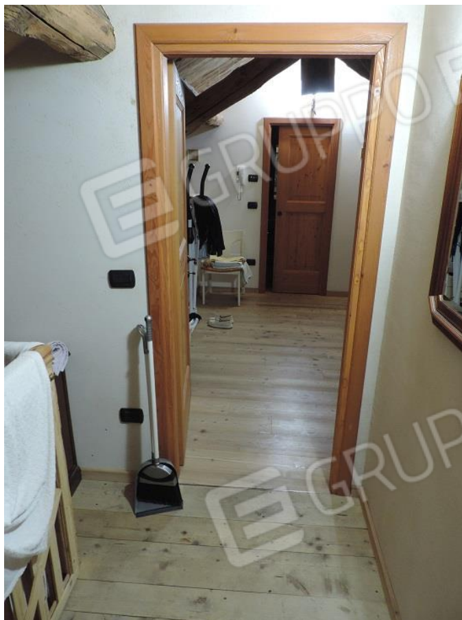
Piano sottotetto suddiviso con pareti in cartongesso