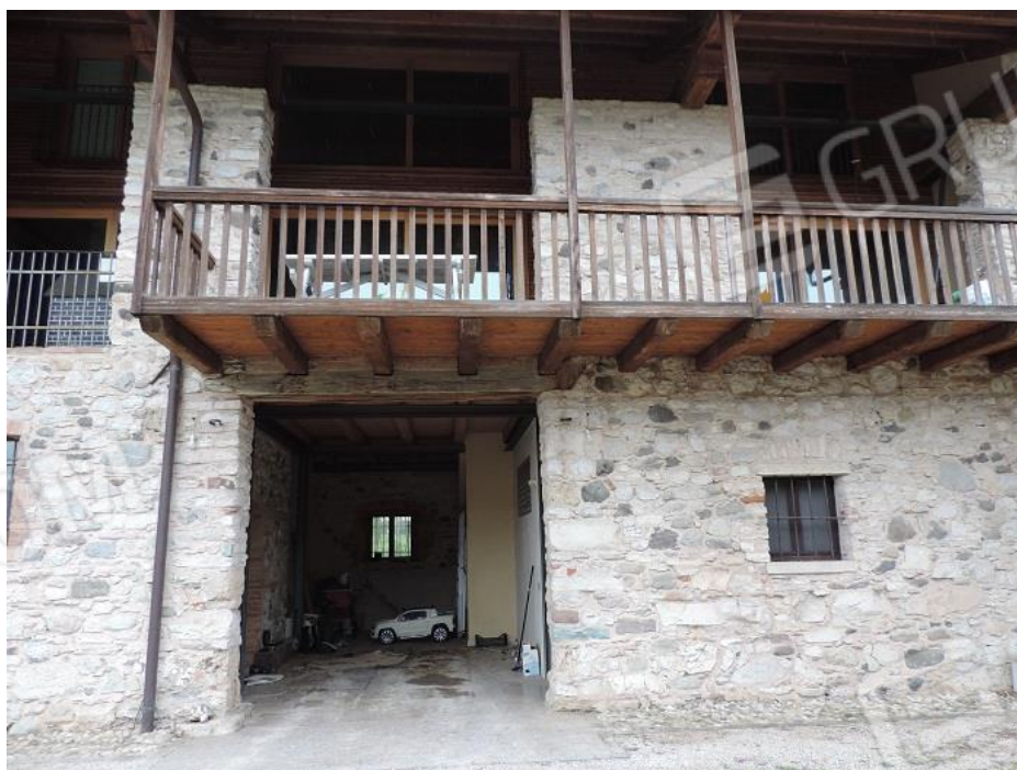
Fg 39 map.le 1093 sub 3 – androne – ingresso