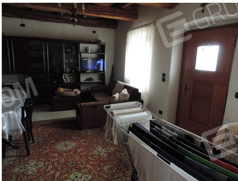
Soggiorno – ingresso al piano terra