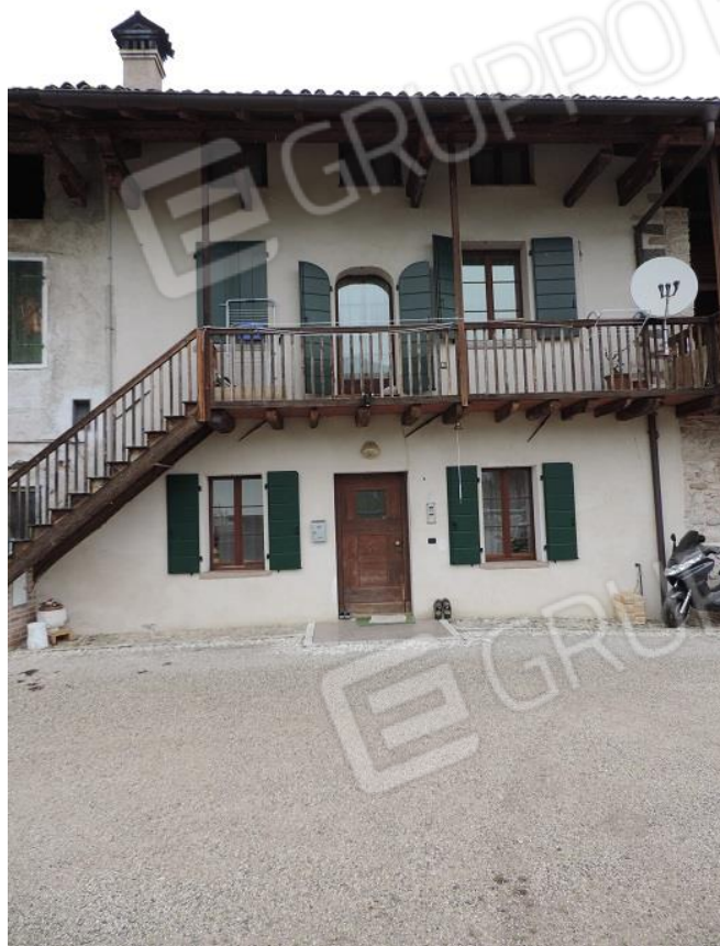
Lato Sud map.le 1093 sub 2 con corte antistante