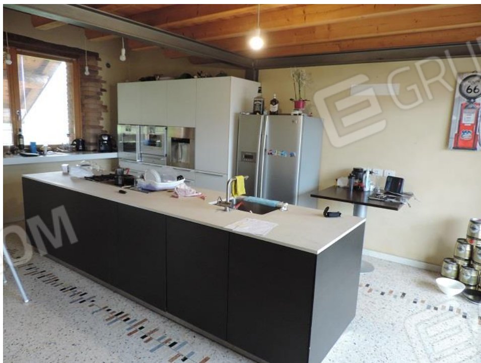
Cucina al P1