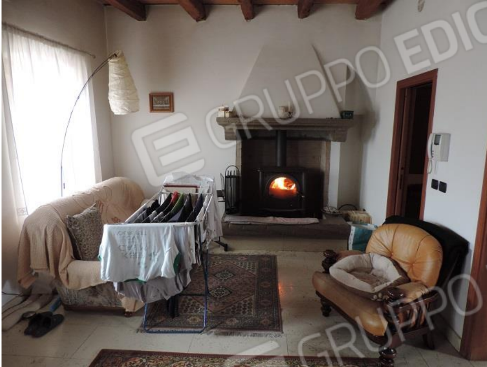
Soggiorno al piano terra