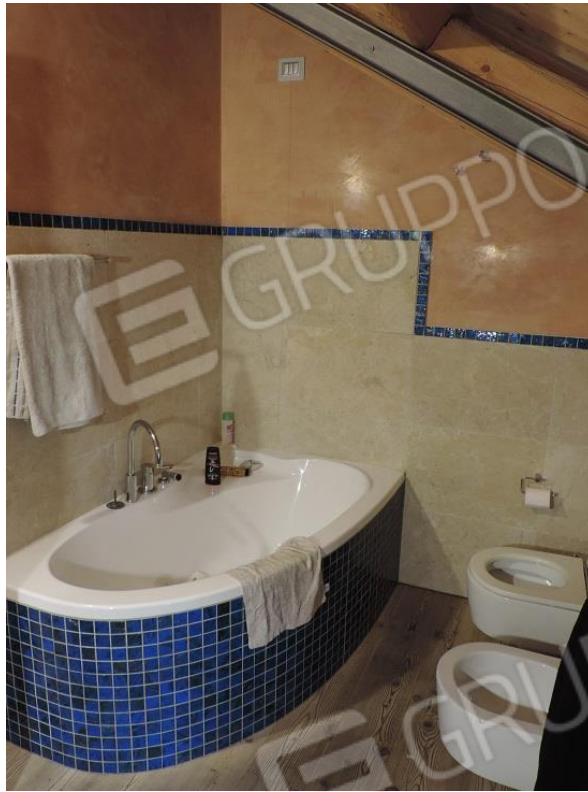
Bagno con vasca idromassaggio al piano secondo