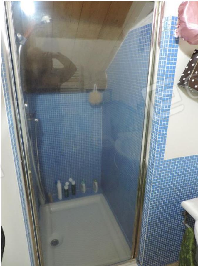
Bagno con doccia al piano secondo