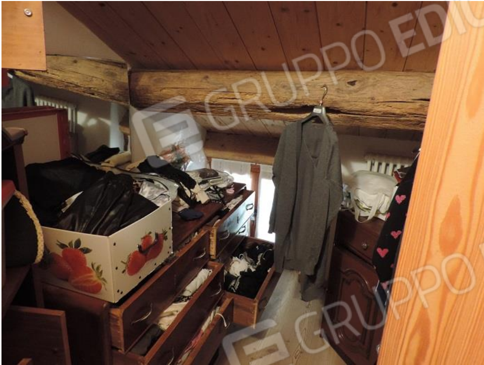
Locale ripostiglio al piano secondo