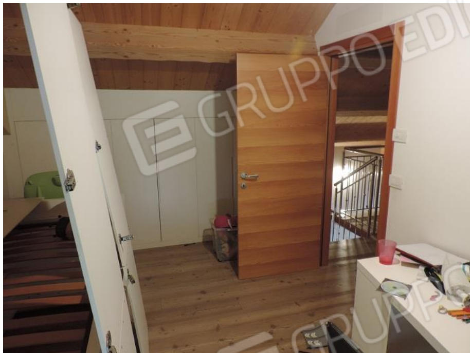
Camere al piano secondo