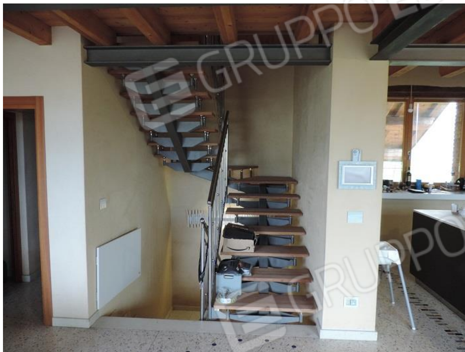
Scala per accesso al soppalco lato Est