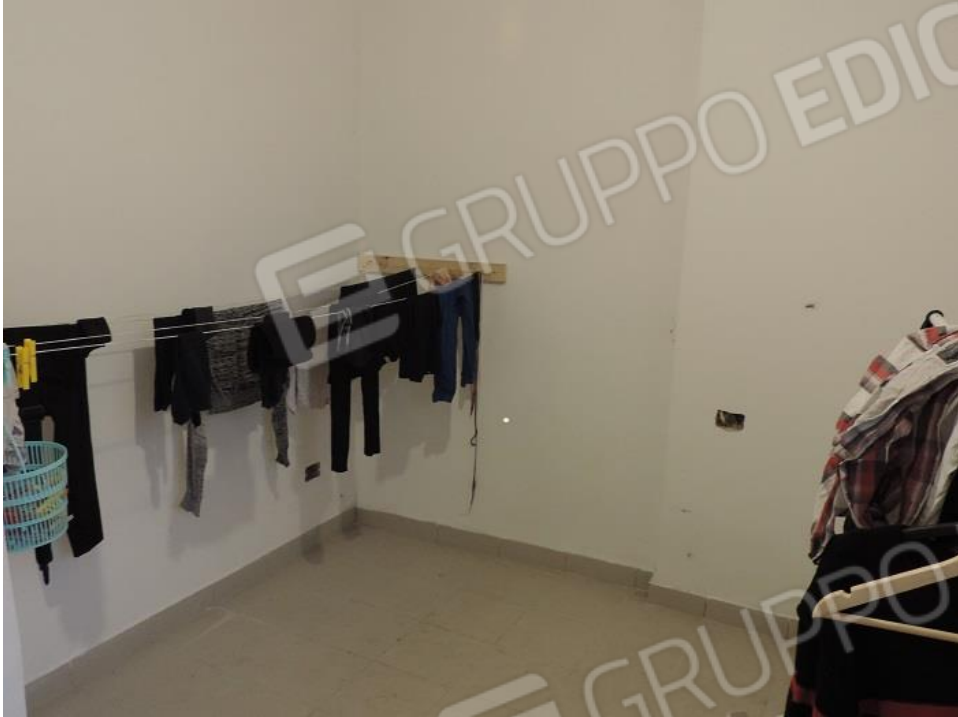
Lavanderia al piano terra