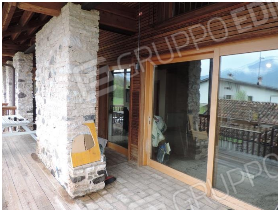
Ballatoio – terrazzo