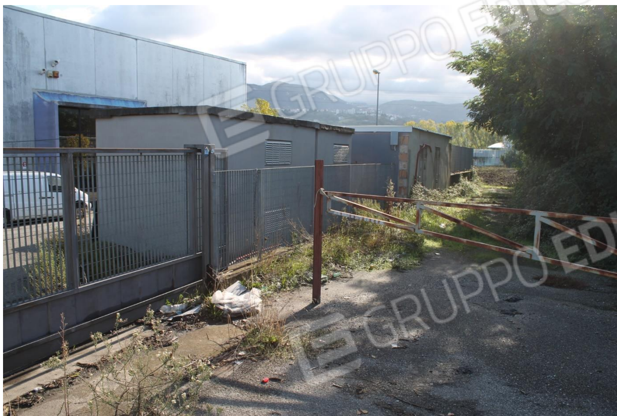
Foto n.29 – locali tecnici (p.la 498-499-363) vista dall'esterno della recinzione e stradella con servitù