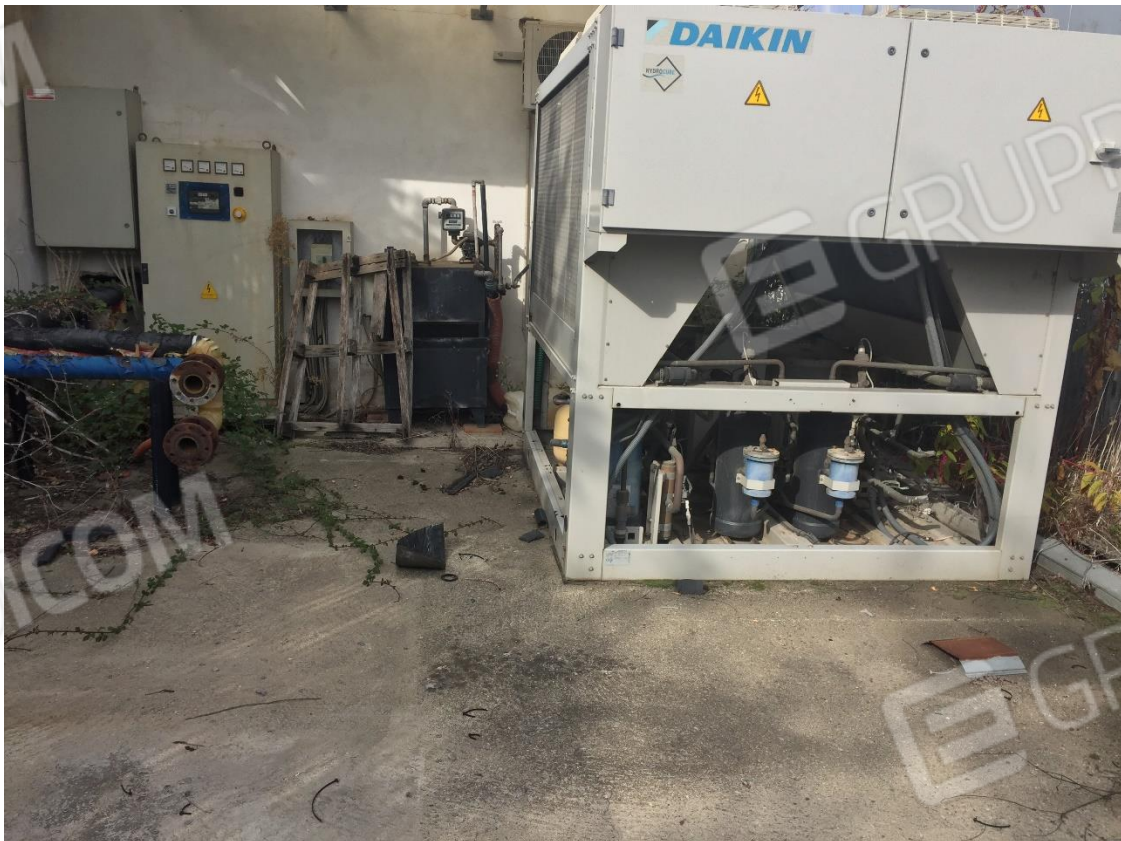
Foto n.34 – locale recintato contenente gruppo elettrogeno e macchina climatizzazione