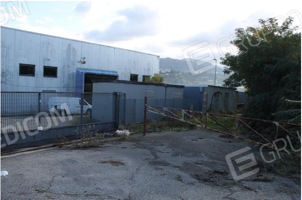
Foto n.28 – locali tecnici (p.la 498-499-363) vista dall'esterno della recinzione