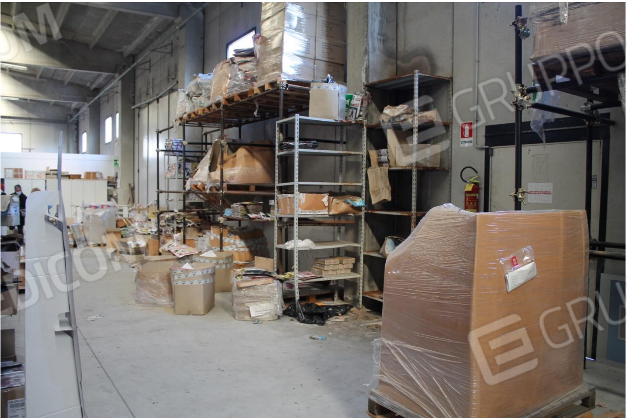
Foto n.14 – Capannone (p.lla 346) – foto dettaglio infiltrazione laterale e infissi