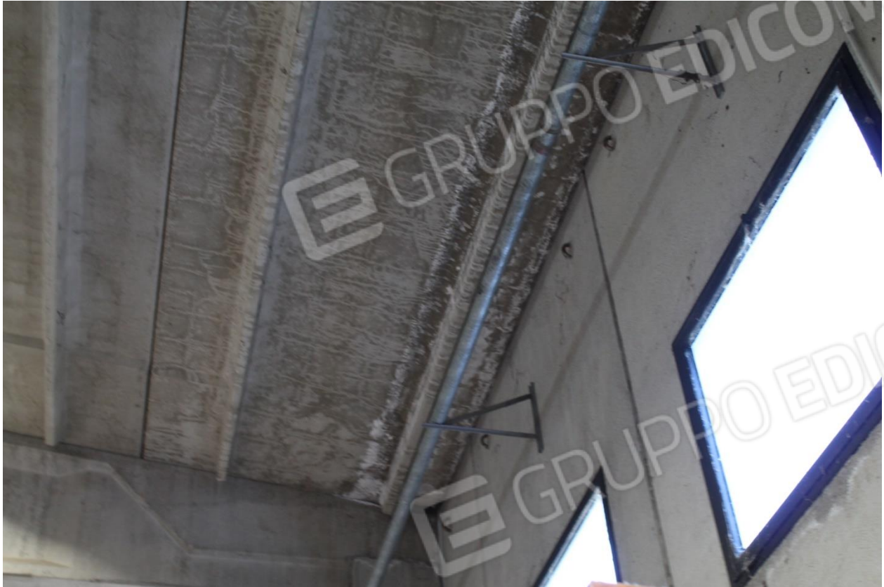
Foto n.13 – Capannone (p.lla 346) – foto dettaglio infiltrazione da copertura