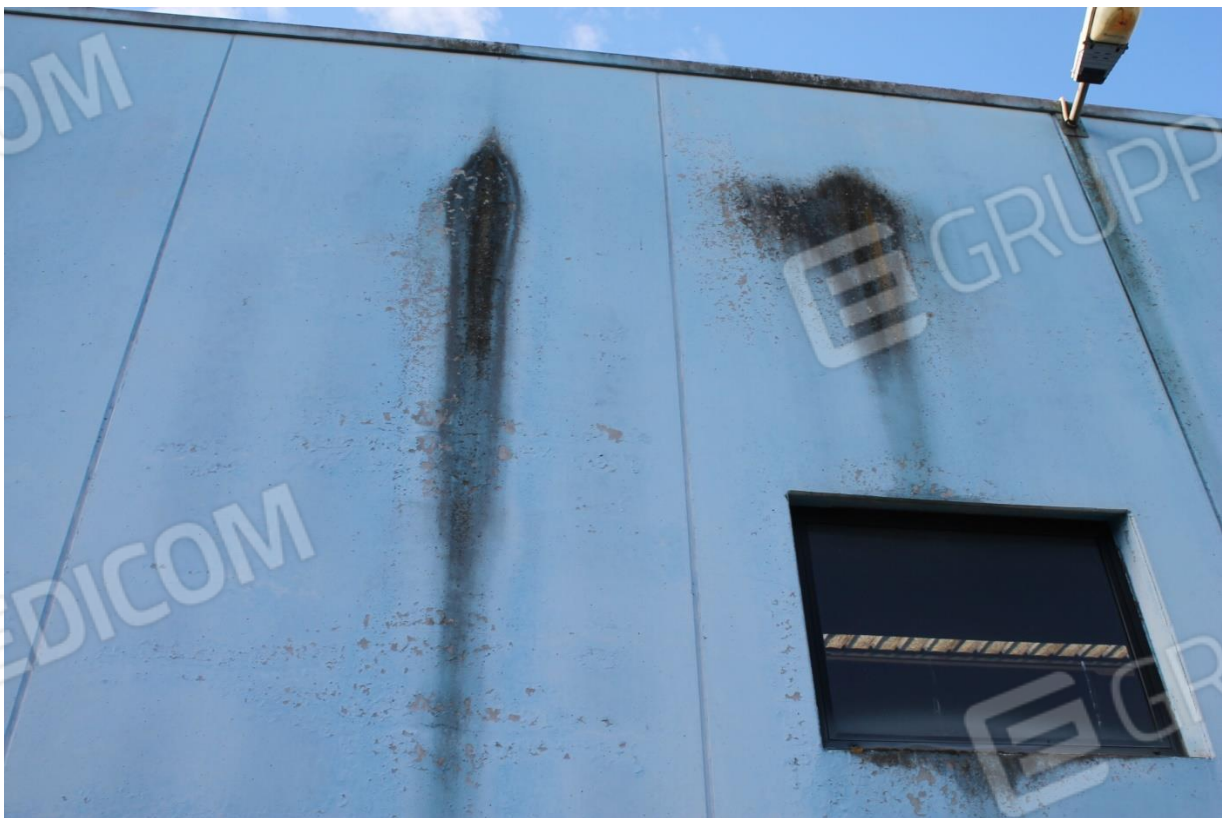
Foto n.4 – Capannone (p.la 346) – dettaglio infiltrazioni e deterioramento facciata