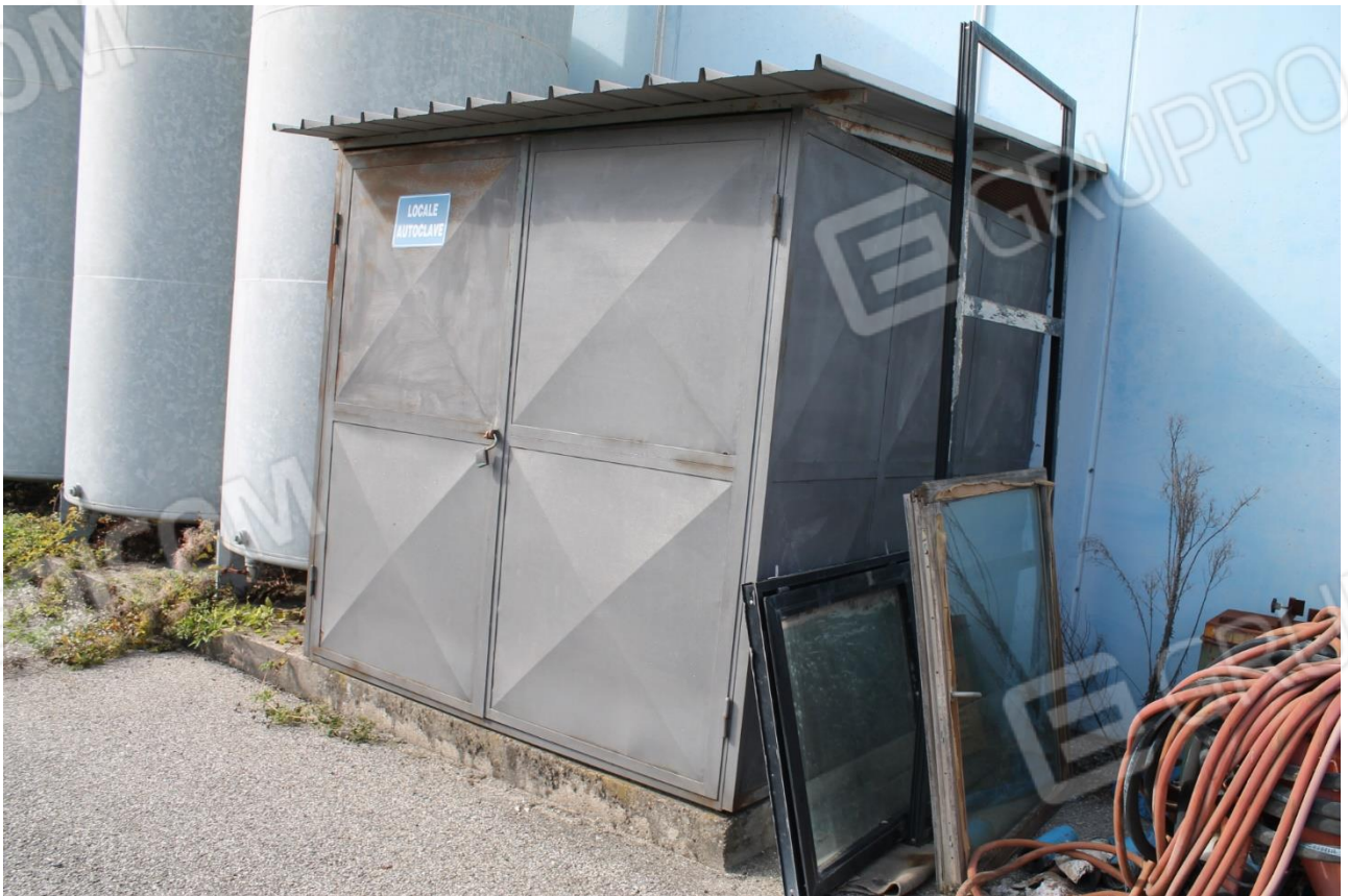
Foto n.6 – Capannone (p.lla 346) – box per locale tecnico antincendio