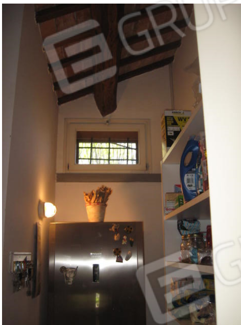
Cucina con ingresso dispensa e dispensa-acquaiuto