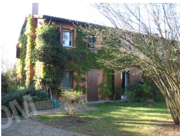
Scorcio fronte est e prospetto posteriore