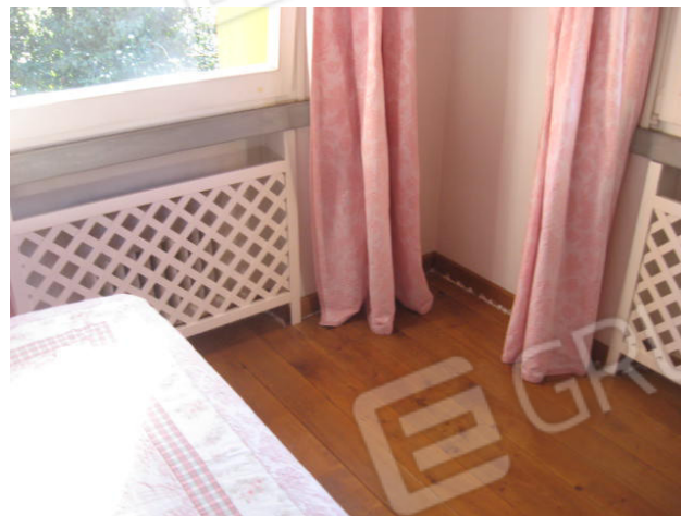
Bagno piano primo e particolare camera