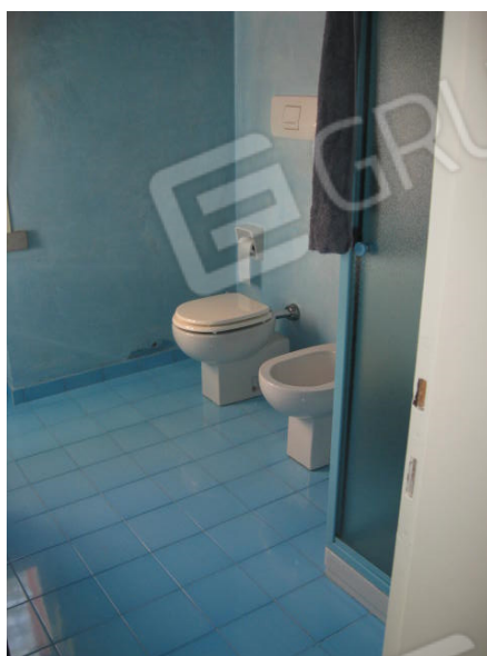
Camera da letto e bagno piano primo