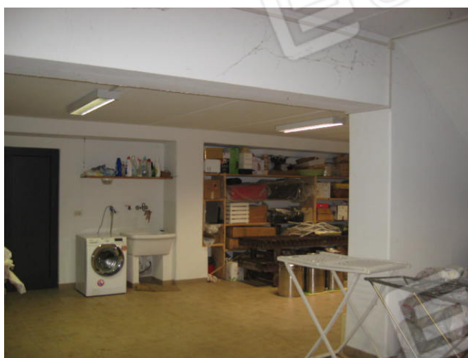
Rampa acceso al piano inferiore e cantina