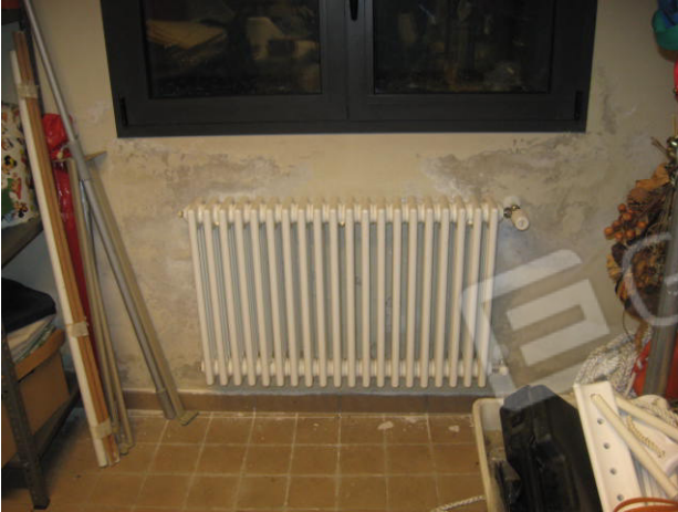
cantina e centrale termica