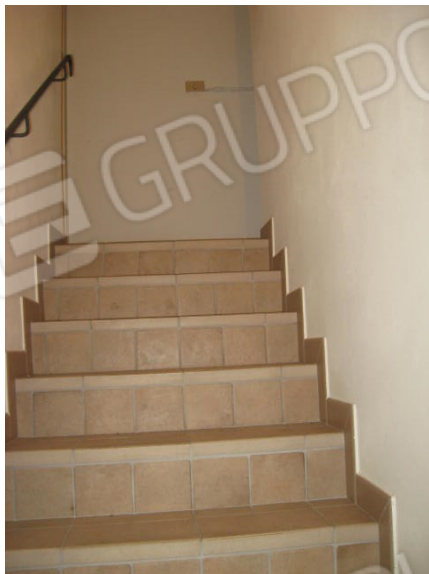
Cantina e scala dal piano interrato al piano terra