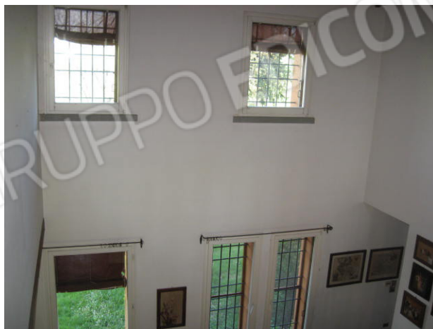
Particolare intradossso copertura e vista dal soppalco