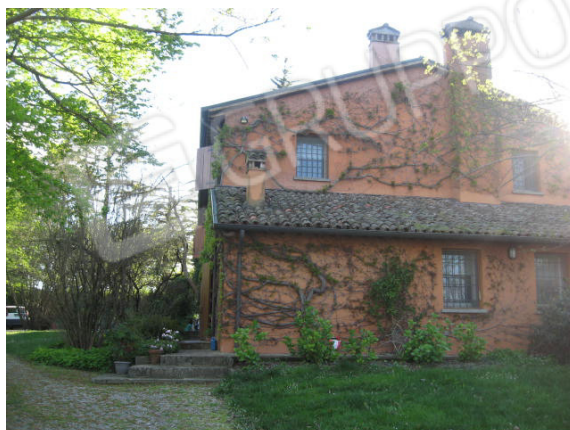
Accesso al fabbricato e vista