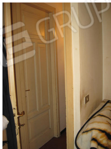
Bagno e disimpegno-camera