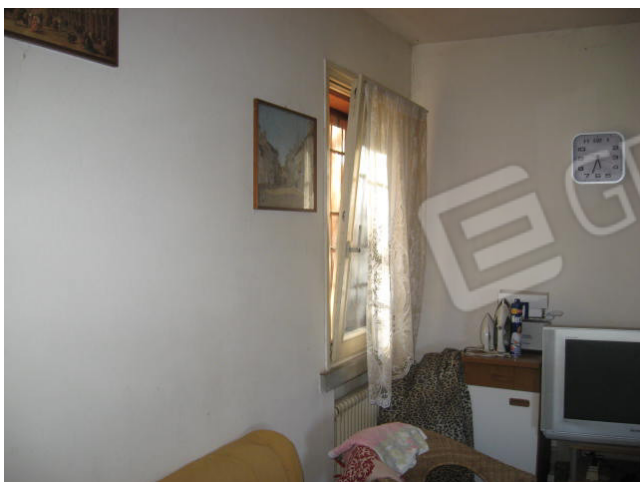
Cucina – soggiorno