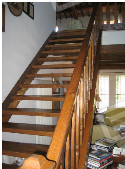
Soggiorno e scala accesso al piano superiore