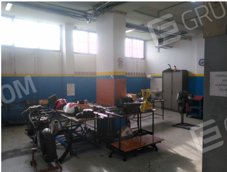
Figura 10 - Laboratorio Meccanico Piano Terra