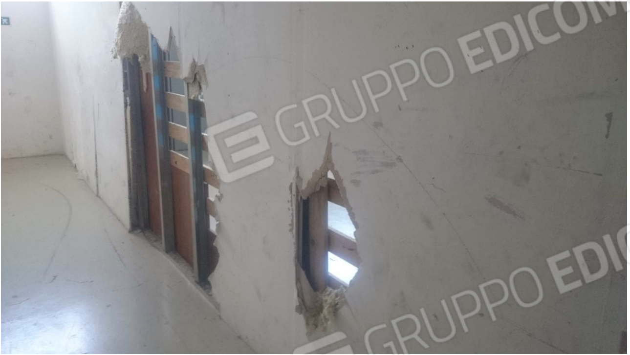
Figura 11 - Danni Tamponature Piano Terra