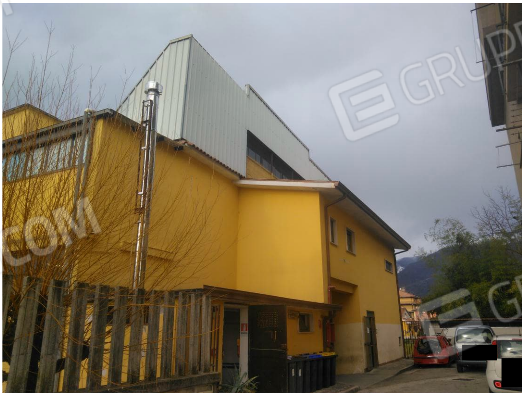
Figura 2 - Vista Posteriore