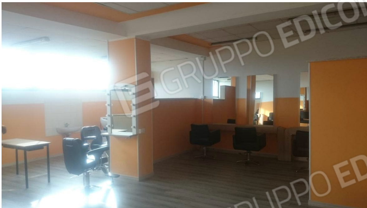
Figura 7 - Laboratorio Acconciature Piano Primo