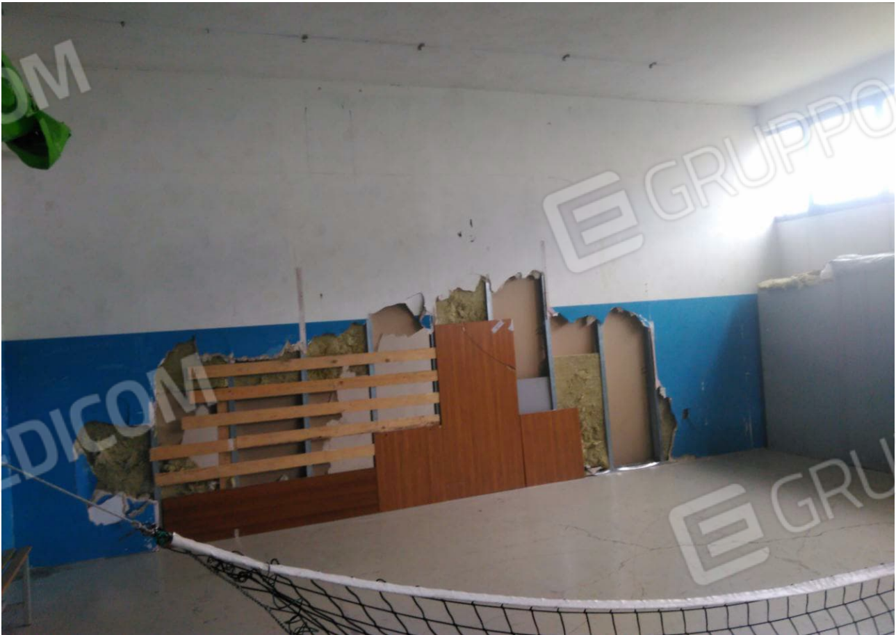
Figura 12 - Danni Tamponature Piano Terra