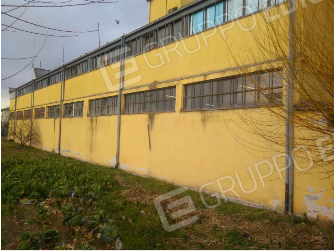
Figura 3 - Vista Laterale