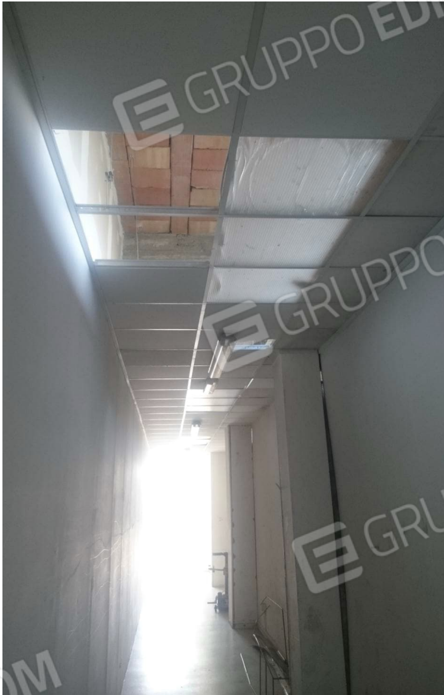
Figura 13 - Danni controsoffitto Piano Terra