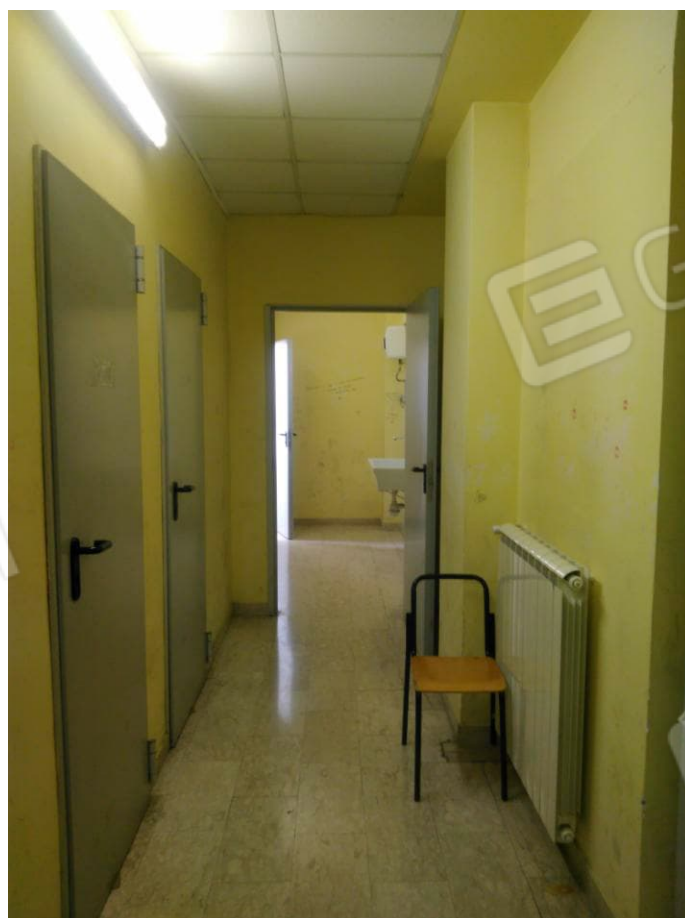
Figura 8 - Bagni Piano Primo