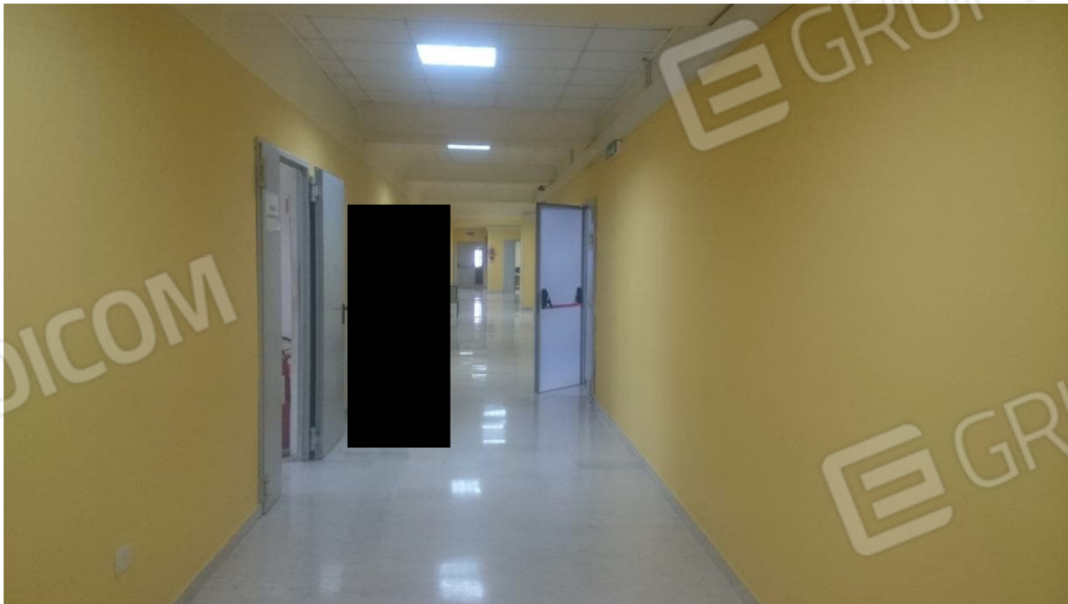
Figura 4 - Corridoio Piano Primo