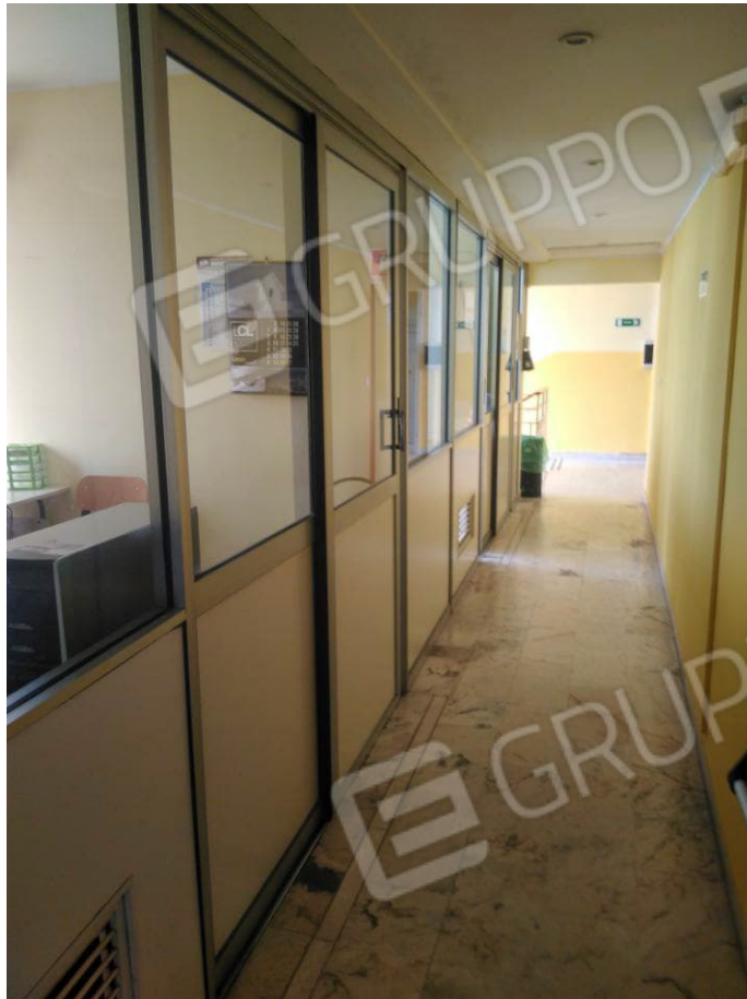
Figura 9 - Uffici Piano Primo