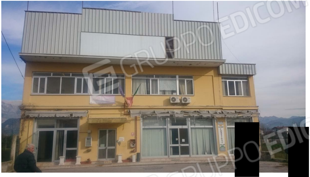
Figura 1 - Vista Frontale